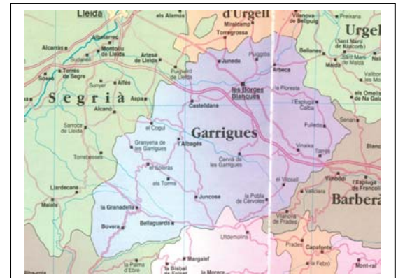
La comarca de Les Garrigues