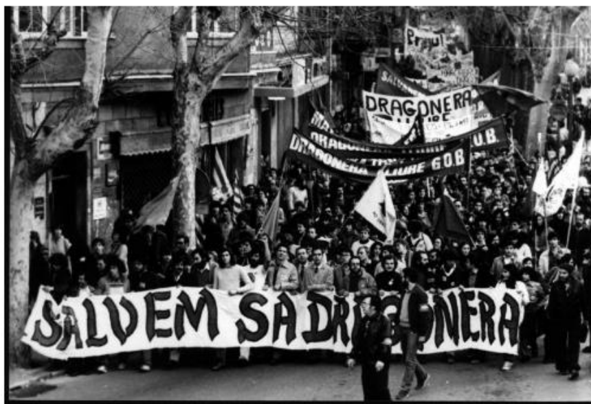
(Primeres manifestacions ecologistes a Palma. Anys vuitanta. https://imagenes-cdn.diariodemallorca.es/multimedia/fotos )

Recordem que una de les figures capdavanteres del moviment ecologista fou el GOB, nascut a finals de 1973, en un primer moment amb objectius de caire ornitològic, encara que ben aviat va ser evident que no podria seguir-se aquesta tasca sense la protecció dels espais naturals. Per aquesta raó, a la seva denominació original, Grup Balear d'Ornitologia, s'hi afegí ràpidament el cognom de "i Defensa de la Naturalesa". (Serra, 2020).