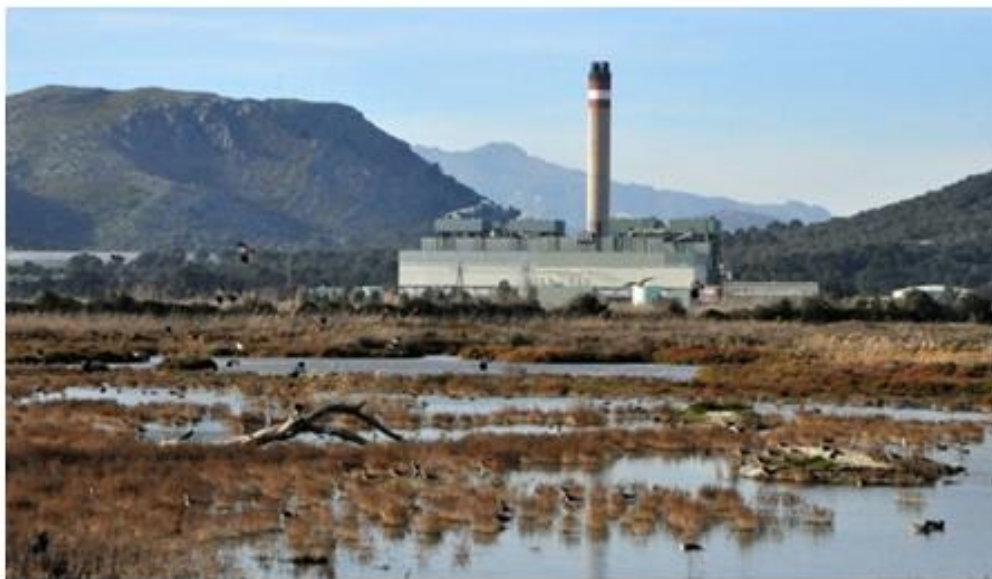
(Central tèrmica d'es Murtrrerar. https://www.google.com )

Així, pel que fa a les condicions ambientals es varen anar degradant paulatinament, alhora que des del punt de vista de la pesca les captures de llops, dorades i sobre tot anguila, entraren en recessió. (Picornell, 1985, pàg.13).