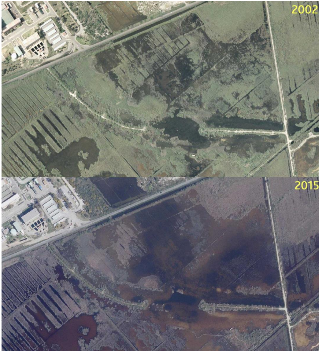
(Desaparició del canyissar a la zona nord del parc natural, a causa de la salinització.)

Un segon problema al qual s'ha d'enfrontar el parc és el que té a veure amb la qualitat de les aigües. En aquest sentit estem assistint a un procés d'eutrofització i salinització que comporta la generació d'importants canvis ambientals que impliquen la substitució d'hàbitats i espècies.