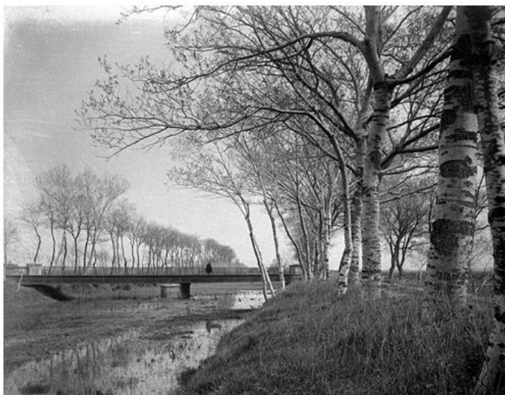
(Pont de ferro de Son Carbonell.)

Respecte d'aquests últims, és destacable la tècnica utilitzada per a la seva construcció, mitjançant reblons i no soldadures, procediment que en el futur seria utilitzat per a la construcció de la Torre Eiffel a París. (Canyelles et al, 2003, pàg.39).