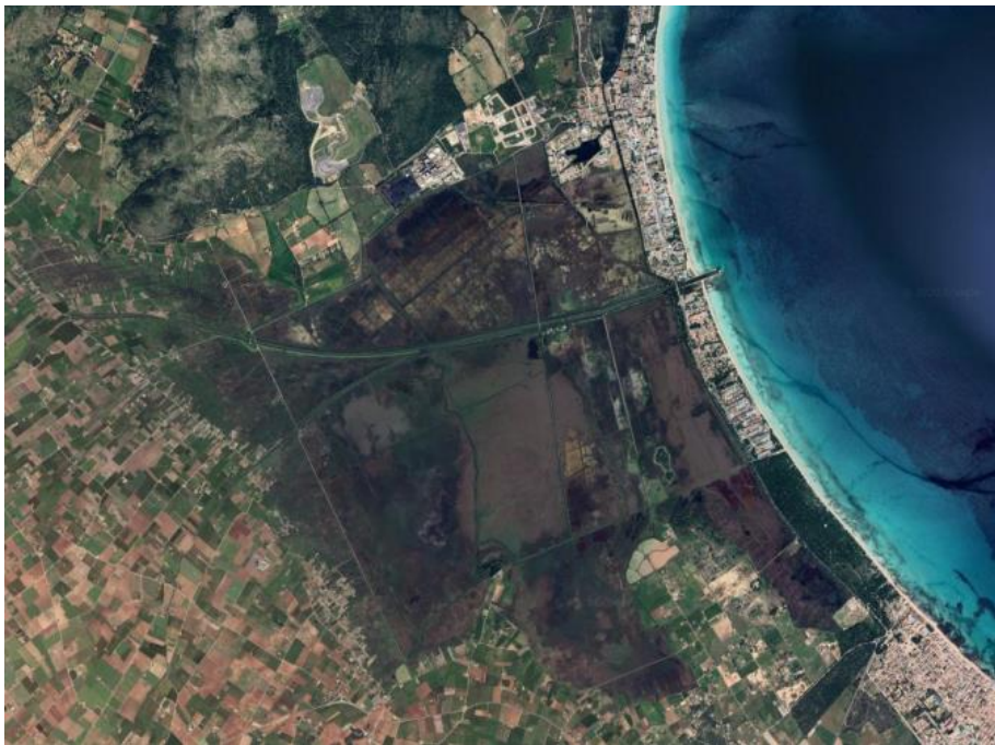
(El parc natural avui, flanquejat al nord per les zones turístiques confrontants i al sud per les marjals poblera i murera.)

Un altre dels problemes és el que té a veure amb la qualitat de les aigües que arriben o afecten al voltant del parc. Així, "Les depuradores de Sa Pobla i Muro podrien millorar molt la seva eficiència. Es van fent passes al respecte però no a la velocitat que seria adient. La Central Tèrmica d'es Murterar també ha suposat un problema per a la zona humida, tant en l'àmbit hídric com químic. Sortosament, el seu tancament ja es troba en procés". (Perelló, Annex II, pàg. 47).