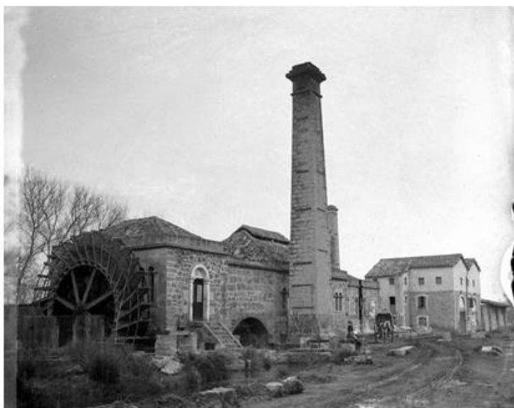
(Fàbrica de paper. Arxiu Andreu Muntaner. www.cronica-desalbufera.com )

En qualsevol cas, la fàbrica de s'Albufera assolí un gran prestigi, amb uns primers deu anys de gran producció, en el transcurs dels quals arribà a la xifra de 2.000 tones anuals,