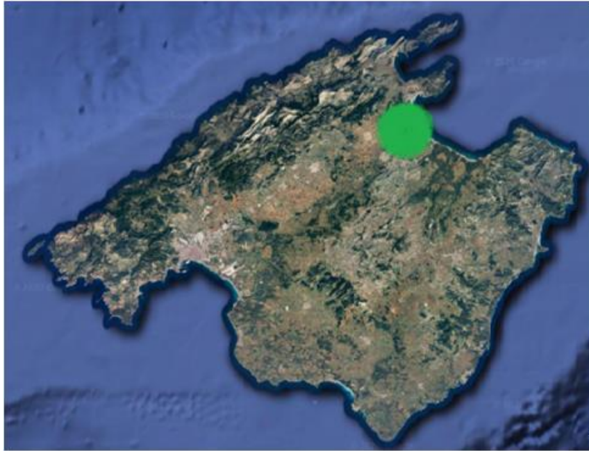
(S'Albufera. Ubicació. Imatge obtinguda de Google Earth . Elaboració pròpia)

Pel que fa al seu origen geològic, tot i que és difícil de precisar, tot pareix indicar que l'aiguamoll que avui coneixem s'hauria format en el període Holocè i hauria anat canviant la seva extensió, salinitat i profunditat de les aigües d'acord amb els canvis del nivell de la mar de cada moment. (Mayol, 1995, pàg. 272).