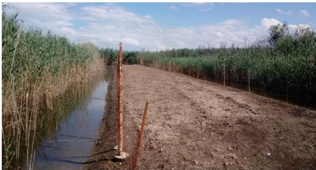
(Morfologia d'una vela funcional prop del municipi de Sa Pobla. Gual, 2018, pàg.24)

Així, una vela és “una porció de terreny, generalment inferior a un quartó, guanyada a l'albufera mitjançant l'excavació de siquions o carreres i incorporant la terra d'aquests sobre el terreny que es vol conrear. D'aquesta manera, es sobrepassa l'altura de les terres primes i s'aconsegueix un sistema òptim de conreu de forma que la capa freàtica es troba entre 0,5 i 1 de profunditat”. (Gual, 2018, pàg. 3).