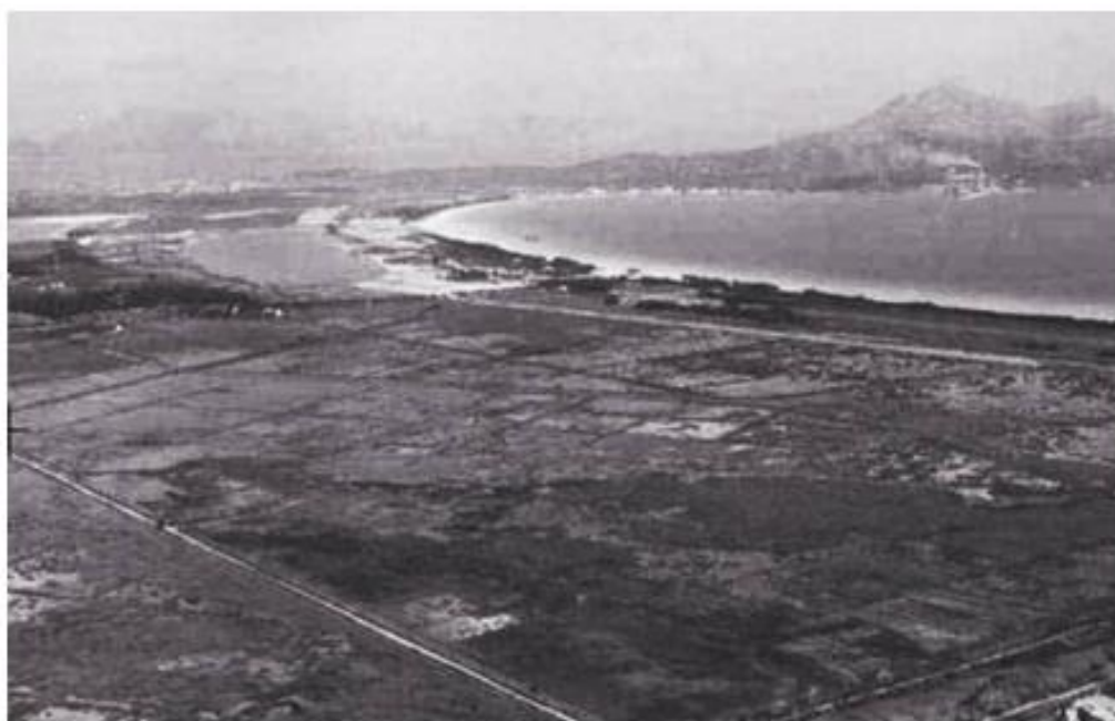
(Imatge aèria de s'Albufera dins el municipi d'Alcúdia. Anys quaranta del segle XX, abans del inici del procés urbanitzador. https://www.facebook.com/fotosantiguasdemallorca )

El projecte dels militars es complementava amb la prolongació del tren des de sa Pobla fins a Alcúdia, les obres de la qual no arribaren a finalitzar-se. (Espinosa et al, 2014, pàg. 46).