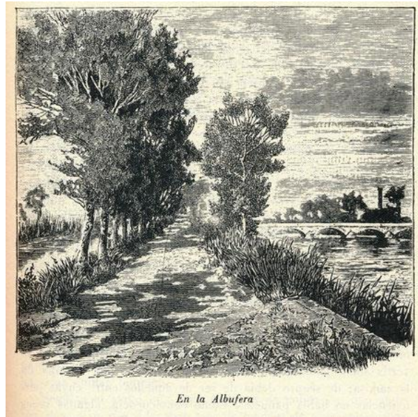
(Gravat de s'Albufera en la seva màxima esplendor. 1887. Letters from Majorca. ) Charles William Wood. www.cronicadesalbufera.com )

Al respecte, H.R. Waring, aleshores ja en qualitat de gestor de la finca, elaborà un informe titulat Drainage, Irrigation and Cultivation of the Albufera of Alcudia , (1878) 12 , redactat per a la seva presentació a l'Exposició Universal de París, on unes mongetes pobleres foren premiades amb una medalla d'or. (Perelló, 2015, pàg. 56).