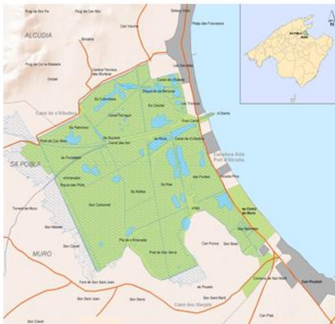
(Plànol del parc natural. https://www.caib.es/sites/espaisnaturalsprotegits )

El parc natural de s'Albufera de Mallorca és la zona humida més extensa i important de les illes Balears amb una extensió de 1.646,48 ha i l'aigua és la base de la seva riquesa biològica.