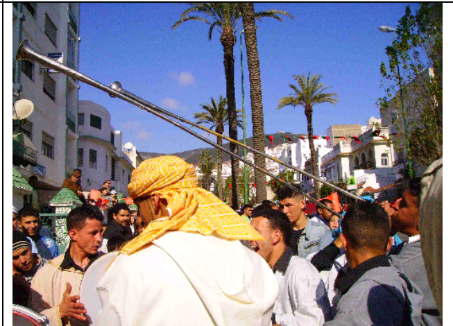
Los grupos de música se mezclan con la muchedumbre agolpada en las estrechas aceras que espera la llegada del rey y contribuyen a animar el ambiente