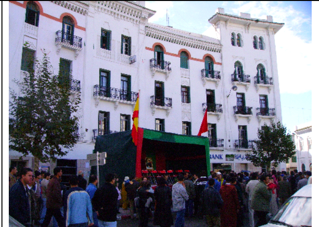
La Plaza Primo es el lugar preferente para la realización de actos públicos y oficiales. En este caso, la celebración del día de la Constitución española