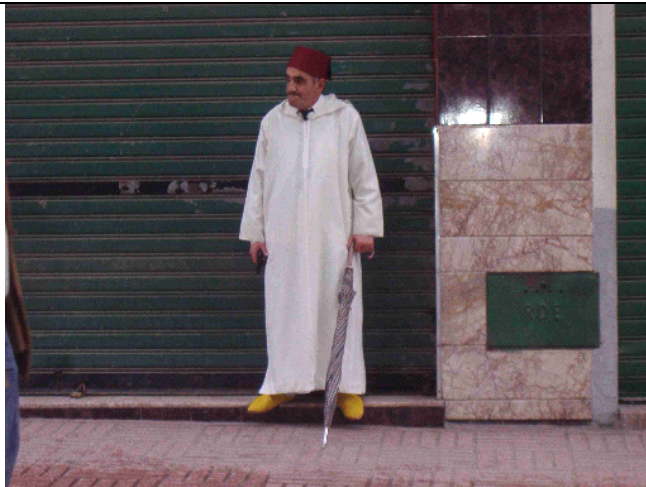
El birrete granate, la chilaba blanca de tela fina y las babuchas de piel labradas conforman el vestido el tradicional en las grandes ocasiones