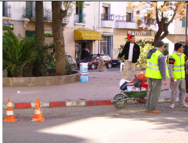
Los grupos de trabajadores con petos amarillos pintando los bordillos de las aceras llaman la atención de los transeúntes por lo inusual de la escena