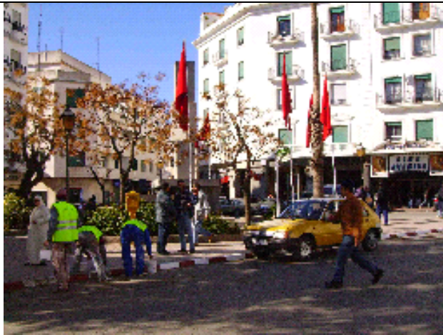
Los empleados municipales y de la wilaya son prácticamente inexistentes en el día a día de la ciudad. Su aparición en las calles está asociada a la próxima llegada del rey