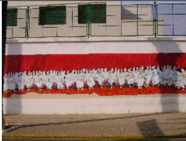
Algunas paredes descuidadas de las calles por las que circulará el rey son pintadas, bien en blanco bien con murales, días antes de su llegada