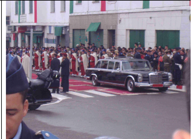
Las calles de acceso a la mezquita se cubren con alfombras para el paso de los coches de la comitiva real. Generalmente, la asistencia del rey a la mezquita para el rezo de los viernes, es retransmitida en directo por la televisión y ocupa lugar preferente en los medios de comunicación. Por tanto, los preparativos y la ostentación están mucho más calculados que en otros actos