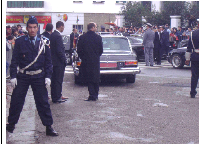
No está permitido tomar fotos del rey y la policía reacciona fuertemente ante la presencia de las cámaras que no sean de los medios de comunicación identificados y controlados