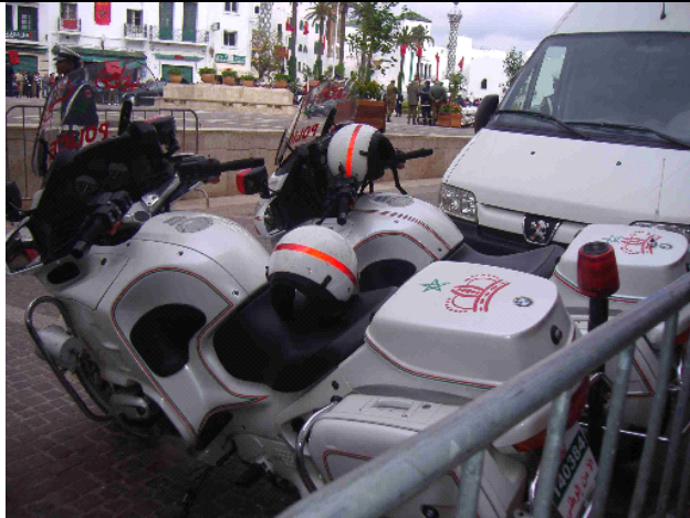
El rey llega a Tetuán con sus propios cuerpos de seguridad. El acceso al Feddan está mucho más restringido que de costumbre ya que el rey entra y sale por la puerta principal de palacio durante su estancia