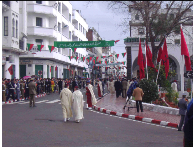
El rezo del rey en la mezquita Hassan II, situada en uno de los extremos de la Av. Mohamed V, de es uno de los momentos de máximo esplendor y expectación durante la estancia del rey. Todo el Ensanche está cortado, vallado y muy vigilado. La guardia real se viste de gala y los acompañantes del rey lucen sus trajes tradicionales