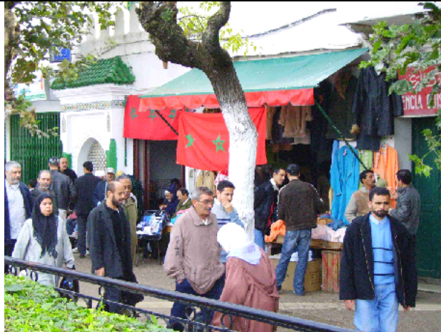
Incluso las calles de la medina, poco permeables a representaciones del poder o fotos del rey, colgaron la bandera nacional durante la Fiesta de la independencia