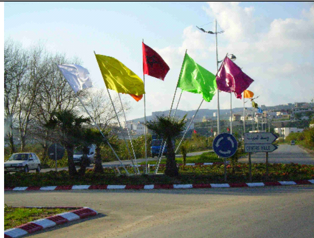
Las rotondas y cruces principales de avenidas y calles son siempre ocupados con cualquier tipo de soporte alusivo a la fiesta o a la presencia del rey. Las banderolas de colores se utilizaron profusamente en la última visita real