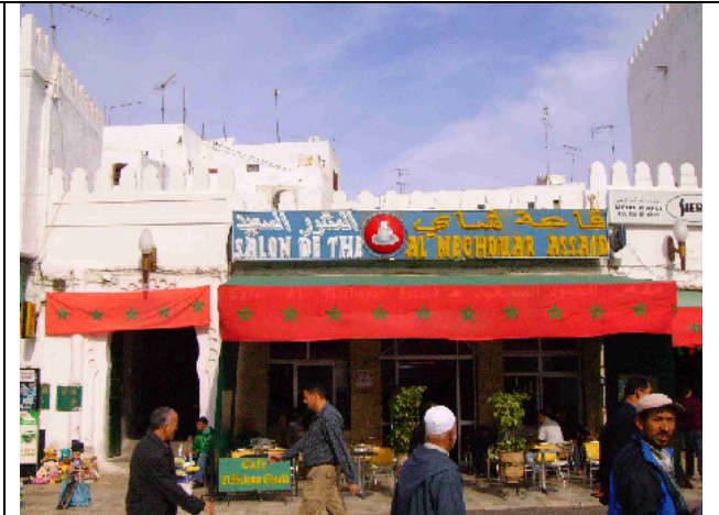
Durante la Fiesta de la independencia la mayoría de comercios y establecimientos públicos de los barrios centrales de la ciudad fueron decorados con la bandera nacional. No se ha podido identificar si correspondió a un gesto espontáneo o directrices de las autoridades locales