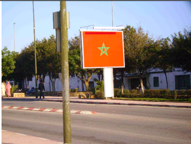
La bandera nacional de Marruecos empezó a colocarse en las vallas publicitarias desde la última Fiesta de la independencia. Hasta entonces, solo el retrato de Mohamed VI tenía el privilegio de ocupar este tipo de soportes