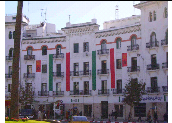
En poco tiempo, la Plazo Primo se preparó para acoger las banderas y decoración habitual de las fiestas, una pantalla gigante para retransmitir fotos y documentales de la independencia, un escenario para el concierto de la banda española en el Día de la constitución española y una jaima para mostrar al rey los planos y trabajos de las obras públicas en la ciudad