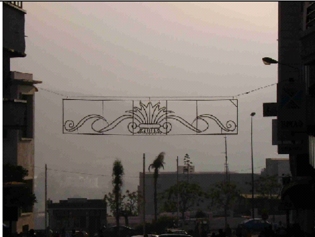
La decoración luminica de las calles juega con motivos florales, con similitudes con una corona real