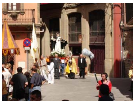
La processó, amb els seus elements, arriba a la plaça de la catedral. Vic. 5 de juliol de 2007

Arribats al lloc, la comitiva es va partir i una part es va situar al davant. Al mig s'hi van situar el tintinacle, el pavelló, la relíquia i la imatge; al darrere hi havia els representants del consistori amb l'alcalde. A bon ritme es va fer camí cap a la catedral situada a la part baixa de la ciutat.