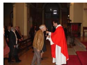
Bes al reliquiari de Santa Coloma. Centelles. 31 de desembre de 2007