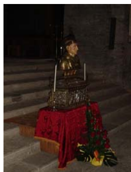
Reliquiari de sant Eudald disposat per la rebre devoció davant l'altar. Ripoll. 11 de maig de 2007

Una estona abans de l'inici de la missa, prevista per les 11 del matí, els primers fidels ja arribaven a l'edifici. Alguns d'ells s'apropaven a mirar, de prop, el reliquiari de Sant Eudald, que havia estat disposat al final del passadís central de la nau just abans de les escales que condueixen al creuer on hi ha l'altar. Lentament es van ocupar totes les places de seient i molta gent va quedar-se dreta. Tot i que la majoria era gent adulta, més