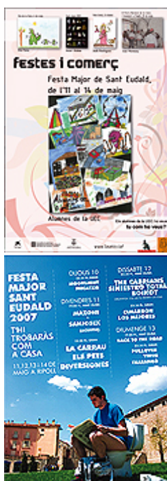
Cartell de la Festa Major de Ripoll de l'any 2007. Ajuntament de Ripoll

El contacte amb l'Ajuntament de Ripoll va ser molt diferent. Allà, des del departament de cultura, es va atendre l'entrevista. A la pregunta de per com es coordina el programa de la Festa Major amb la celebració dedicada a les relíquies es va respondre que "la festa