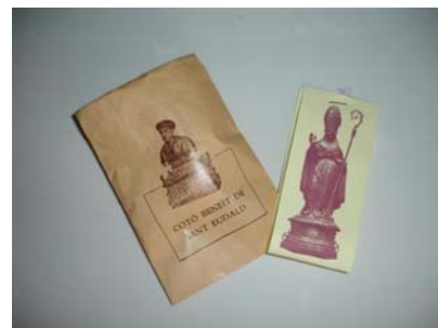
Mostres proporcionades als fidels dels “cotons” de sant Eudald i sant Patllari en l'acte de devoció de l'any 2007