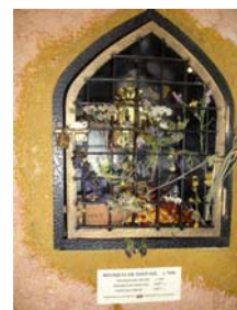
Relíquia de sant Gil a la seva capella al santuari de Núria. Agost de 2006

De l'alta edat mitjana hi ha diverses dades sobre relíquies a Catalunya. L'any 713, per exemple, l'arquebisbe Pròsper de Tarragona va fugir de la invasió musulmana enduent-se les relíquies dels màrtirs Fructuós, Auguri i Eulogi cap a terres genoveses on va fundar un monestir 94 ; posteriorment serien sol·licitades a Catalunya i retornades, concretament, a Sant Fruitós de Bages 95 . El 877, el bisbe Frodoí de Barcelona, a instàncies del metropolità Sigebod de Narbona, va cercar i trobar, a l'església de Santa Maria de les Arenes, les relíquies d'Eulàlia de Barcelona, les quals van ser traslladades –el 23 d'octubre del 877- solemnement a la catedral com testimonia una lapida 96 .