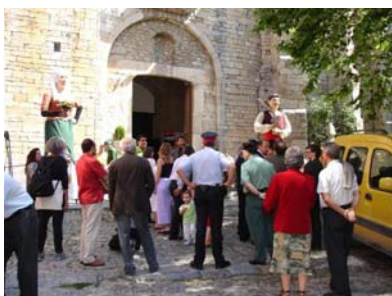
Les autoritats, acompanyades pels Gegants, es dirigeixen a l'ofici de sant Patllari. Camprodon. 21 de juny de 2007