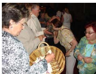
Imatge del bes a la figura de 'Sant Patllari petit' i recollida del “cotó”. Camprodon. 21 de juny de 2007