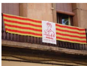
Emblema amb el reliquiari de sant Eudald penjat a moltes finestres i balcons de Ripoll durant la Festa Major. Maig de 2007

Precisament, en una capella lateral del monestir de Santa Maria de Ripoll hi ha la capella de sant Eudald en la qual es pot visitar i retre culte, tot l'any, a les relíquies de sant Eudald.