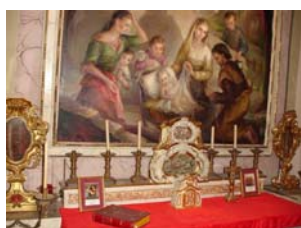
Reliquiaris a l'oratori particular de la casa Cortada de Vic. Març de 2007