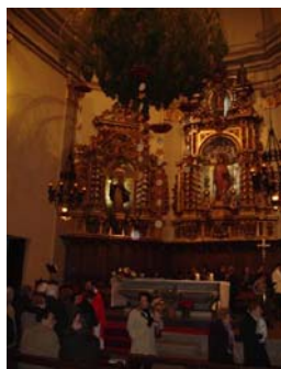
El pi penjat davant la fornícula de santa Coloma i damunt dels devots que besen el reliquiari de la santa. Centelles. 31 de desembre de 2007

les relíquies, es queden a la catedral. La gent no s'ho ha preguntat mai però, molt abans de la processó i de manera silenciosa, el reliquiari és conduït des de la catedral, on és sempre juntament amb d'altres, fins a la casa natalícia de Sant Miquel on esperen el pas de la resta del seguici; la resta de l'any, estan a la catedral i no reben cap devoció especial”.