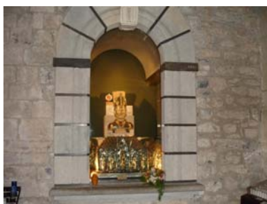
Reliquiari de sant Patllari exposat a la fornícula d'una capella lateral de Santa Maria. Camprodon. 21 de juny de 2007

A l'acabament de la missa, una hora després, es va procedir a beneir el "cotó de Sant Eudald" per part dels sacerdots. Després van fer acte de devoció a les relíquies tot besant el reliquiari i es va convidar als presents a fer el mateix apropant-se al reliquiari