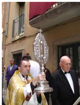
El reliquiari de Sant Miquel dels Sants és conduït, en processó, a la catedral. Vic. 5 de juliol de 2007