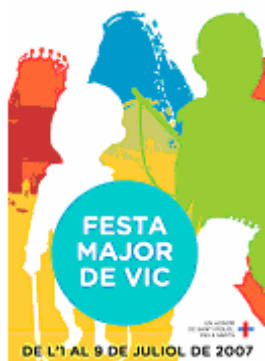
Cartell de la Festa Major de Vic de l'any 2007.

El caràcter històric de Sant Miquel dels Sants fa que la ciutat de Vic tingui diversos espais on es constata la seva presència. La casa natalícia (situada al carrer de Sant Miquel dels Sants número 9) va ser convertida, a partir de la beatificació, en una capella pública i oratori 140 ; també hi ha una capelleta al límit nord-est del nucli urbà on es recorda un fet miraculós vinculat al sant quan era infant.