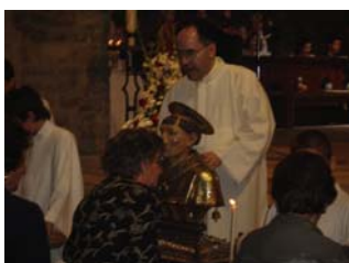
Imatge del bes al reliquiari de Sant Eudald i recollida del “cotó”. Ripoll. 11 de maig de 2007