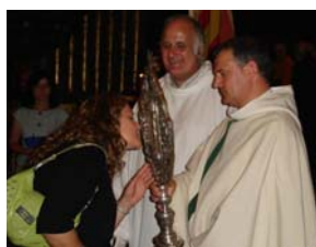
Bes al reliquiari de Sant Miquel dels Sants. Vic. 5 de juliol de 2007