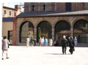
La gent, endiumenjada, es dirigeix a l'ofici de Festa Major. Ripoll. 11 de maig de 2007

Ripoll.- A la capital del Ripollès, l'11 de maig és la Festa Major. En aquest dia se celebra l'acte amb connotacions més protocol·làries, juntament amb el pregó; és l'ofici solemne de Sant Eudald que sol tenir lloc a Santa Maria de Ripoll, església parroquial que forma part de les construccions del monestir.