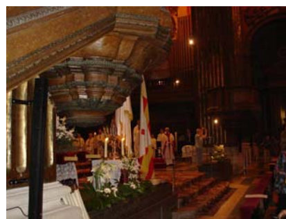
Durant l'ofici el reliquiari és col·locat en lloc destacat. Vic. Juliol de 2007