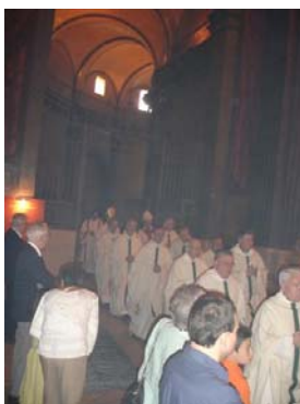
Grup de religiosos es proposa a iniciar l'ofici de Sant Miquel dels Sants. Vic. Juliol de 2007

Una hora després de començar, la missa anava tocant a la seva fi. Es va fer lliurament als assistents d'un llibret sobre la vida de Sant Miquel dels Sants i el bisbe va cloure l'ofici convidant a tots els presents a cantar els goigs del sant, dels quals tothom va trobar-ne un full amb la lletra redactada, i a apropar-se a la part central de davant l'altar per besar la relíquia.