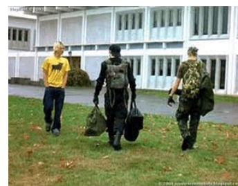
Elephant (2003), film nord-americà dirigit per Gus Van Sant, en què es presenta una perspectiva sobre els assassinats comesos per dos estudiants a l'escola secundària de Columbine.

En primer lloc, la Convenció internacional dels drets dels infants estableix que tot adolescent sospitós o declarat culpable d'haver infringit lleis penals