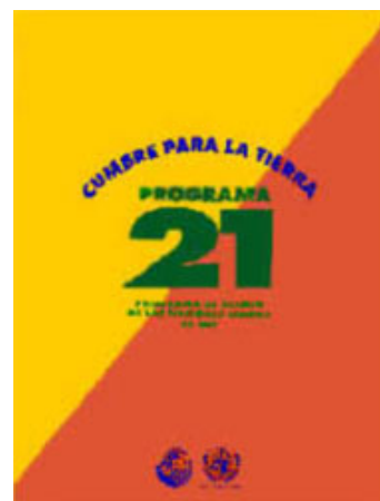
Logotip d'Agenda 21

Hilary French. (2002, 15 d'octubre). From Rio to Johannesburg and Beyond: Assessing the Summit (World Summit Policy Brief #12, Worldwatch Institute).