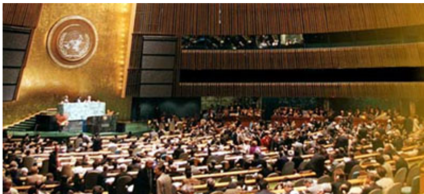
Assemblea General de l'ONU, en la qual estan representats la pràctica totalitat d'estats de la terra.

En l'àmbit de l'ONU, els òrgans principals amb competències en la matèria són l' Assemblea General i el Consell Econòmic i Social de les Nacions Unides (ECOSOC), dels quals depenen òrgans subsidiaris creats per a tractar aquest tipus de qüestions. Entre aquests últims, són especialment significatius: