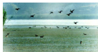
Imatge de les zones humides