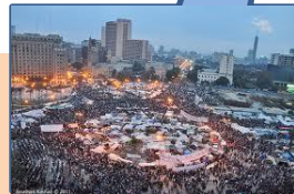
Primavera árabe Enero 2011