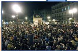
#15M Mayo 2011