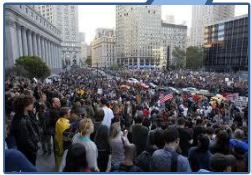
Occupy Wall St. Septiembre 2011

Acampadas de simpatía se dieron en varios países del mundo en el verano de 2011