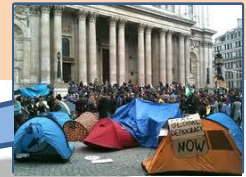
Occupy London Octubre 2011