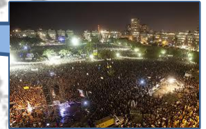
Acampada de Tel Aviv Julio 2011

Acampadas de simpatía se dieron en varios países del mundo en el verano de 2011