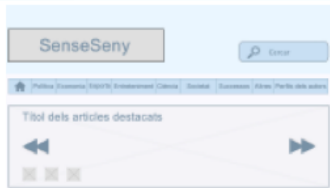
Wireframe capçalera de la versió per a ordinador