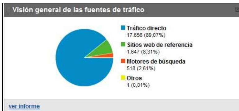
Gràfic 2: Fonts de tràfic web BV UOC.

Agregació i categorització de les fonts del tràfic ( referrals ): es comptabilitzen els orígens del tràfic de xarxa per a cada pàgina monitoritzada i cada accés es categoritza en quatre epígrafs: tràfic directe, motors de cerca, llocs web de referència i altres. Com a resultat obtenim dades quantitatives i percentatges respecte al total d'accessos i en relació amb el lloc des d'on accedeix l'usuari.