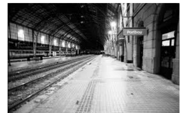
Quién mató a Walter Benjamin (2005). El director espanyol David Mauas busca respostes a les circumstàncies dubtoses de la mort del filòsof alemany al seu documental.

L'absència d'espais simbòlics i reals de realització dels projectes, el carrer com a àmbit de socialització, la pobresa reproduïda i controlada en el gueto, el treball que no proporciona el que és bàsic per a satisfer les necessitats, l'empobriment de les relacions familiars, van impeding la realització d'experiència.