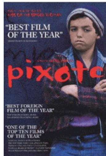
Film brasiler del director Héctor Babenco (1981)

“[...] la respuesta penal del Estado es el ejercicio de violencia formal legalizada y monopolizada. Es decir una dosis de violencia que se aplica siguiendo determinados procedimientos rituales, los juicios penales [...]” (Fernández, 1995, p. 42).