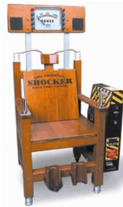
"Joc electrònic" polèmic situat al centre comercial de la ciutat de Rosario, Argentina, on els infants podien experimentar la sensació subtil de l'electricitat al cos.