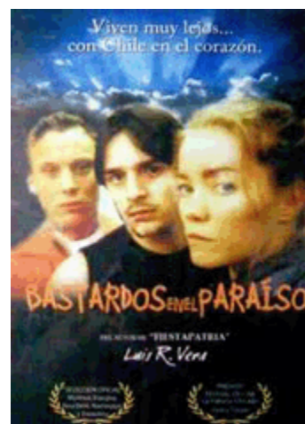
Bastardos en el paraíso (2000), pel·lícula suecoxilena del director Luis Vera. Dóna compte de complexitats d'integració d'un jove d'origen xilè en la societat sueca.