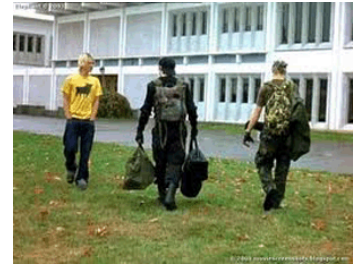
Elephant (2003), film nord-americà dirigit per Gus Van Sant, en què es presenta una perspectiva sobre els assassinats comesos per dos estudiants a l'escola secundària de Columbine.

"[...] ha de ser tractat d'acord amb el foment del seu sentit de la dignitat i el valor, que enforteixi el respecte de l'infant pels drets humans i les llibertats fonamentals de tercers."