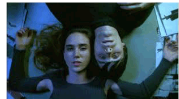
Requiem per un somni (2000), pel·lícula nord-americana del director Darren Aronofsky. Explica els somnis de tres persones en tres estacions diferents i com acaben tràgicament.

El primer aspecte clau és establir, mitjançant una legislació reformulada i clara, les infraccions (anomenades tipus o figures típiques en el dret penal d'adults) que es podran retreure als infants i joves segons l'edat que tinguin. Això no és més que el que la llei expressi clarament i per endavant quines seran les conductes delictives que ells podran cometre i sobre les quals podran respondre eventualment; queda exclosa la possibilitat que el sistema penal juvenil actuï en tots els casos d'actes que la llei no hauria considerat com a delictes. O sigui, això implica regular un sistema infraccional ancorat i respectuós del principi de legalitat. Només d'aquesta manera les conductes que no respon-