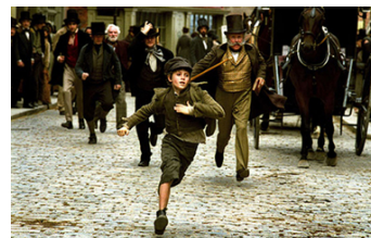
Oliver Twist (2007), pel·lícula basada en la novel·la homònima de Dickens que va ser publicada per primera vegada per lliuraments en una revista entre 1837 i 1839. Dóna compte de les experiències d'infants que sobreviuen als carrers treballant i robant.