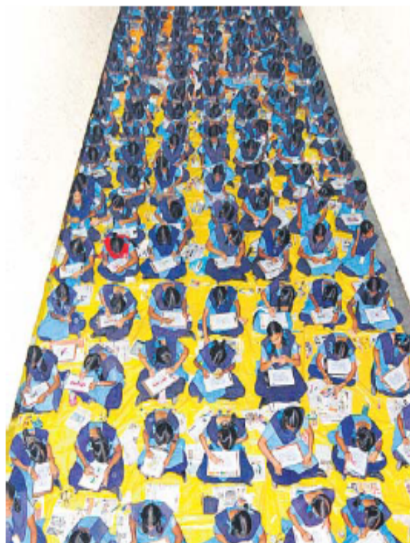
Estudiantes indios en un evento de la escuela de Bellas Artes.

En este sentido, el profesor Mathew Kam, de la Carnegie Mellon University (USA), comentó la posibilidad de emplear juegos tradicionales de las aldeas de la India y los videojuegos de Occidente como fórmulas exitosas para captar la atención de niños y jóvenes.