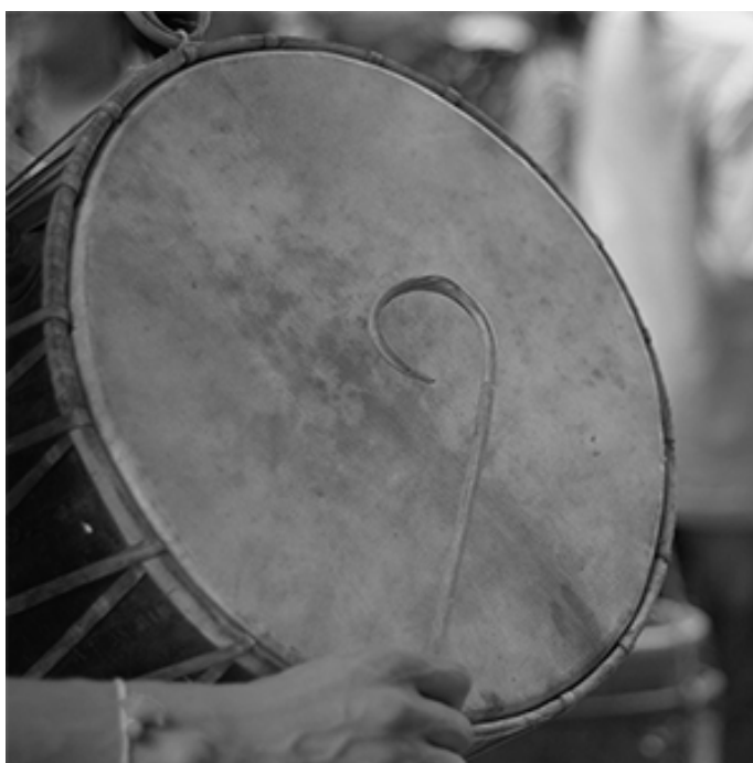
Figura 2. Prova projecte II.