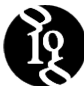
Figura 5. Logo Amalgama reduït.

Aquesta versió, a més, completa la seva significació en la representació esquemàtica de dos personatges, ànima simbòlica del fotògraf i l'escriptor protagonistes del projecte.