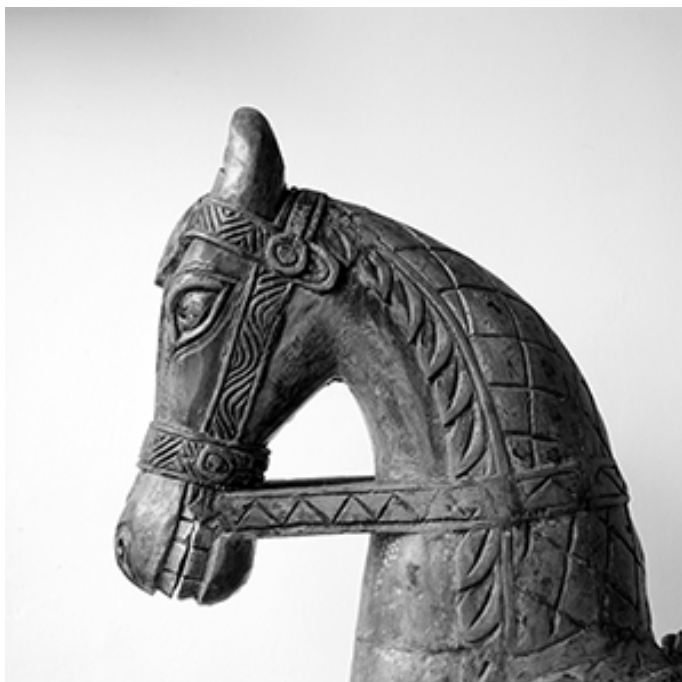
Figura 1. Prova projecte I.