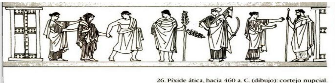
26. Pixide ática, hacia 460 a. C. (dibujo): cortejo nupcial.

"Nombrosos textos indiquen que existeix a la casa grega un espai reservat, on les dones estan entre elles i exerceixen bona part de la seva activitat. L'espai arquitectònic coincideix d'aquesta manera amb el grup familiar específic: el de les dones i els nens. El primer tret sobre el que convé insistir per comprendre el gineceu és la noció de separació."