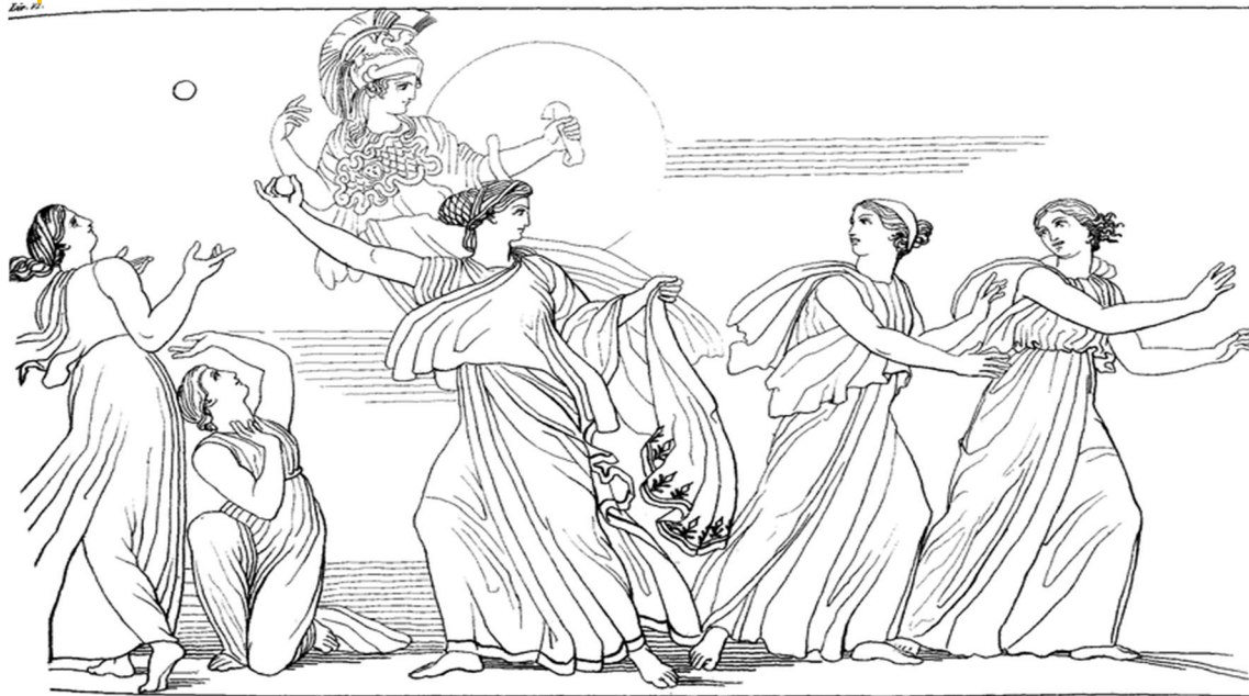
Nausikaa et ses femmes après avoir lavé au fleuve le linge qu'elles avaient apporté, jouent toutes ensemble à la paume.

Illustrations of Odyssey by John Flaxman (1755-1826)