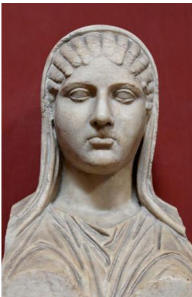
Bust d'Aspàsia, identificat a través d'una inscripció. Marbre. Còpia romana d'un original hel·lenístic. De Torre della Chiarrucia ((Castrum Novum) prop de Civitavecchia.

http://ancienthistory.about.com/od/greeceancientgreece/tp/Ancient-Greece.htm