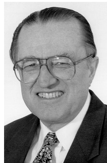
Anthony Downs (1934)

Els supòsits que fa servir la teoria de l'elecció racional que utilitza Downs parteixen d'una reducció de la realitat a un seguit de supòsits sobre el comportament dels individus, i atorguen també a les organitzacions un seguit de característiques (una associació d'individus que comparteixen uns fins comuns) que simplifiquen la realitat, però aquesta estratègia permet una anàlisi de la realitat que no impedeixi la construcció de models explicatius. Com veurem, l'evolució de les teories sobre els partits polítics i la ciència política en general s'ha anat matisant, però la influència de l'anàlisi espacial, en què els partits competeixen per mitjà del seu posicionament en eixos ideològics, ha estat una contribució que ha influït molt en l'anàlisi política.