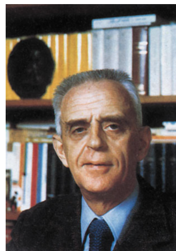
Maurice Duverger (1917) Maurice Duverger va ser el politòleg que va classificar els partits polítics en partits de quadres i partits de masses.

2) La segona llei és que la representació proporcional tendeix a produir un sistema multipartidista, ja que, com que garanteix un repartiment proporcional dels vots entre les diferents candidatures, no es penalitza la fragmentació entre candidatures.