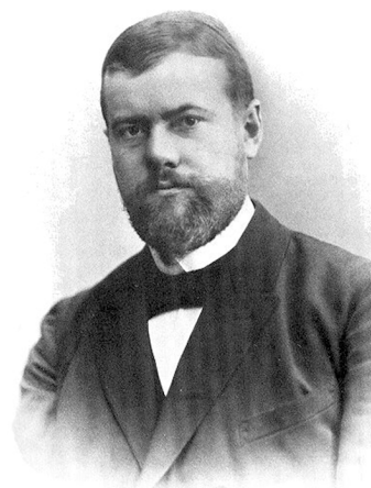
Max Weber (1864-1920)

Així, doncs, durant un temps s'associava la figura dels partits de masses als partits d'esquerra, mentre que el model de quadres s'identificava amb els partits conservadors. De fet, per motius diversos, pràcticament tots els partits polítics disposen d'estructures organitzatives rellevants i d'una base més o menys àmplia de militants. Els possibles problemes de reclutament de membres no és exclusiu d'un tipus de partits o d'un altre, i en bona part la relació entre militants i votants és, en termes generals, similar entre ells.