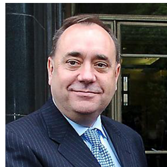
Alex Salmond (1954)

Les posicions territorials de l'SNP han variat amb el temps: d'una banda, respecte als objectius institucionals, entre la devolution com a via gradual que acostés Escòcia cap a la independència i les posicions que apostaven per una via més directa; de l'altra, als inicis el partit era en un punt intermedi entre la-