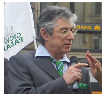
Umberto Bossi (1941)