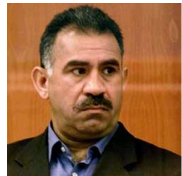
Abdullah Öcalan (1948)