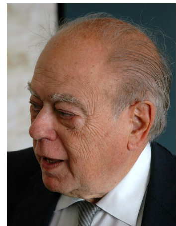
Jordi Pujol i Soley (1930)