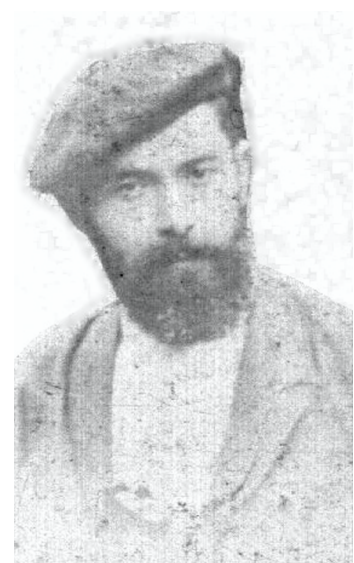
Sabino Arana y Goiri (1865-1903)