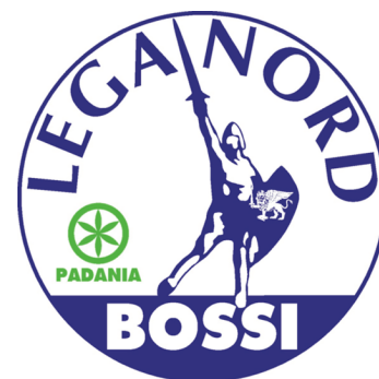
Logotip de Lega Nord

La Lliga Nord es fundà el 1991 en un Congrés que uní diferents partits del nord d'Itàlia, com la Lliga Llombarda, la Lliga Vèneta o la Lliga Emiliano-Romagnola. Des d'un primer moment, la història de la Lliga Nord està intrínscament lligada a la del seu fundador, Umberto Bossi. El 1979, Bossi es va reunir amb Bruno Salvadori, fundador de l'aleshores Unió Valdostana i defensor ferm del federalisme. A partir d'aquí, Bossi va acollir l'organització federal com un dels principis programàtics que havien de dirigir l'acció del seu partit. El moviment de seguida agafà embranzida, com demostra la victòria en diverses administracions locals, la més important de les quals va ser la ciutat de Milà. El 1992 el partit va aconseguir 80 escons: 25 senadors i 55 diputats.