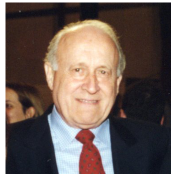
Xabier Arzalluz (1932)

Durant la fosca etapa franquista, el partit va tenir més presència a l'exterior que al País Basc mateix. Prengué part activa en la resistència francesa i intentà reestructurar la seva organització. Després de la victòria dels aliats en la Segona Guerra Mundial, tant Aguirre com la majoria del partit esperaven amb ànsia el final de la dictadura. Tot i això, després de vagues i l'acord del 1953 amb els Estats Units les esperances es frustraren. Amb Jesús María de Leizaola com a nou president, a partir del 1960 el PNB va intentar buscar ajuda a l'exterior. El suport va anar més enllà i el partit va ser un dels fundadors de la Internacional Demòcrata Cristiana. Mort Franco, Leizaola presidí un govern de transició breu i a partir del 1980 va ser Xabier Arzalluz qui va dirigir les regnes del partit quan va ser nomenat president de l'Euzkadi Buru Batzar (EBB). El PNB va recuperar a partir d'aleshores el paper de força política principal de les tres províncies basques. La seva importància era més petita a Navarra.