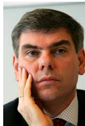
Filip Dewinter (1962)

Hi ha dos canvis, però, que, des del canvi de nom, ha experimentat el Vlaams Belang. El més clar és el de la immigració. L'èxit del partit va començar a ser notori quan les generacions noves van posar més atenció en la immigració que en els issues més purament nacionalistes. En tant que el nacionalisme flamenc del Blok (i també del Belang) es basava en qüestions culturals i lingüístiques, consideren els immigrants com una amenaça a la supervivència cultural dels