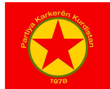
Bandera del Partit dels Treballadors del Kurdistan

Des d'un primer moment, els universitaris reunits al voltant d'Öcalan van adoptar una política antifeixista, fet que els va fer guanyar molts adeptes entre la comunitat universitària. La formació de la Unió d'Estudiants d'Ankara va ser la culminació d'un procés que, al seu torn, va desencadenar fortes protestes del Govern turc i una campanya ideològica massiva contra aquells "turcs de les muntanyes" que lluitaven per l'emancipació del Kurdistan. Un cop fundat