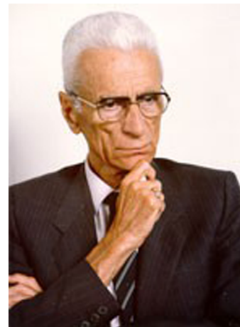
Silvius Magnago (1914)

Les reclamacions, però, no van posar el seu punt final. L'any 1957 va tenir lloc la protesta més massiva del moviment secundat per l'SVP: 35.000 habitants del Tirol van desfilar fins al castell de Singmundskron per demanar més autonomia i el compliment del Tractat de París. Al cap de tres anys, el líder del moviment, Silvius Magnago, va ser escollit governador provincial, càrrec que va ocupar fins al 1989. Va ser durant el seu mandat que el Tirol va aconseguir, el 1972, el primer estat d'autonomia. El procés no va ser fàcil i les discrepàncies es van allargar, amb disputes agres entre els governs regionals i l'italià, a més d'acords d'entesa amb el govern austríac. La llei bàsica d'autonomia (coneguda pels sud-tirolesos com el Paket ) incloïa mesures de protecció pels drets de les minories, autonomia bàsica i actualitzava els acords a què s'arribà en els diferents tractats.