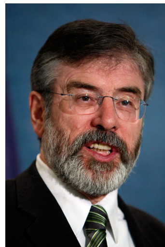
Gerry Adams (1948)

Avui en dia, el partit està compromès amb l'assoliment d'una pau estable a Irlanda del Nord. Per aquest motiu, forma part d'un govern d'unitat en la restituïda Assemblea de la província. Històricament, ha assolit quotes de po-