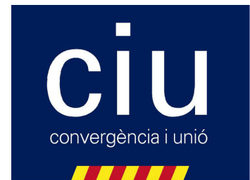
Logotip de Convergència i Unió

Per la seva banda, CDC té els orígens el novembre del 1974 en una trobada a Montserrat, on s'aproven els grans principis que al cap de dos anys donarien lloc al partit: democràcia, sentit social, nacionalisme i europeisme. El partit agrupa diferents sensibilitats, moviments i personalitats del catalanisme, amb el lideratge de Jordi Pujol. El mateix nom del partit pretén simbolitzar aquest encaix de sensibilitats. La formació adopta posicions de centreesquerra no marxista i participa activament en la recuperació de les llibertats de Catalunya (impulsora del Consell de Forces Polítiques, membre de l'Assemblea de Catalunya i integrant del Pacte Democràtic de Catalunya). A les eleccions del 1977, hi concorre en coalició amb Esquerra Democràtica de Catalunya, encapçalada per Ramon Trias Fargas, i amb el Partit Socialista de Catalunya-Reagrupament, liderat per Josep Pallach. Posteriorment, amb la mort de Josep Pallach el PSC-Reagrupament s'integra al PSC-PSOE, mentre que EDC s'integra