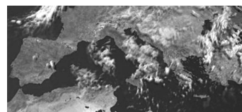
Mapa de la zona del Mediterrani

Es van firmar acords d'associació amb Malta, Xipre i Turquia; amb Israel, un acord de lliure comerç (amb un protocol d'associació), i amb els països del Magrib (el Marroc, Algèria i Tunísia), del Masrek (Egipte, Jordània, Síria i Líban) i l'antiga Iugoslàvia es van signar acords de cooperació.