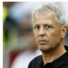
Favre interesa al Bayern Munich