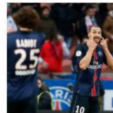
Cuando Rabiot insultó a