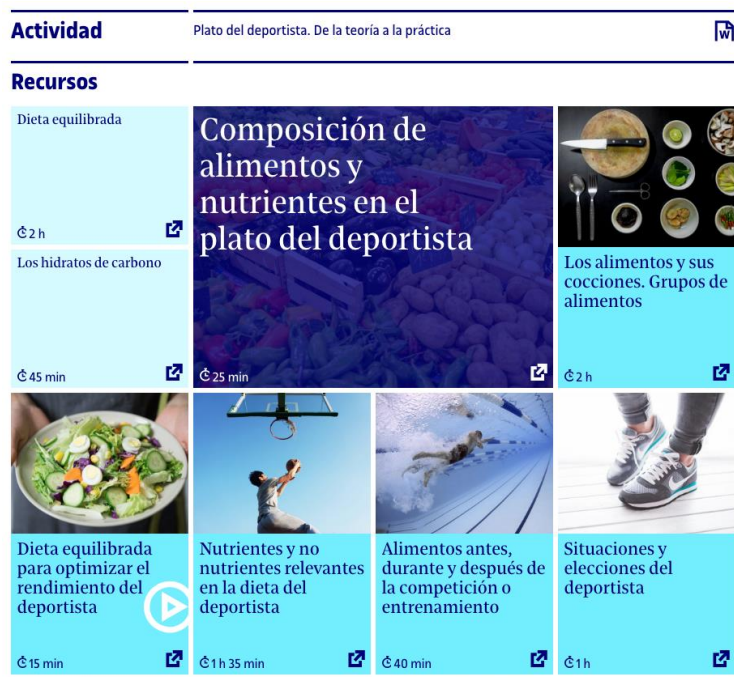
Imatge 2. Imatge d'un Niu (recull de recursos d'aprenentatge) dels estudis de Salut (FUOC, 2017)

Com es veu en la imatge, un Niu es presenta amb una estructura visual en forma de mosaic que permet a l'estudiant veure quina és l'activitat que ha de resoldre i quins són els recursos d'aprenentatge seleccionats per a resoldre-la. A més, cada recurs d'aprenentatge s'acompanya d'informació i orientacions que ajuden l'estudiant a planificar-se i organitzar-se.