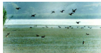
Imatge de les zones humides