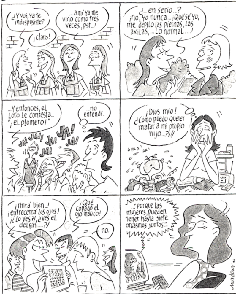
Mujeres alteradas (1997). Buenos Aires: Ed. Atlántida.

Per això, en aquest apartat, farem referència al funcionament de les normes amb el que en psicologia social s'ha estudiat com a pressió grupal, mecanisme de poder i conformisme, a la seva resistència, en termes d'acció, canvi, autonomia i llibertat, per a passar, finalment, a considerar altres formes de pensar el control social en les noves societats informatitzades, globalitzadores i complexes.