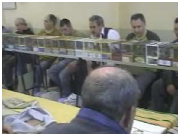
Fotografia d'un concurs d'ocells en l'actualitat.

A part del reconeixement també es fa l'entrega de lots als millors de la seva espècie. Antigament es premiava amb diners. Actualment s'entreguen lots de comestibles i trofeus.