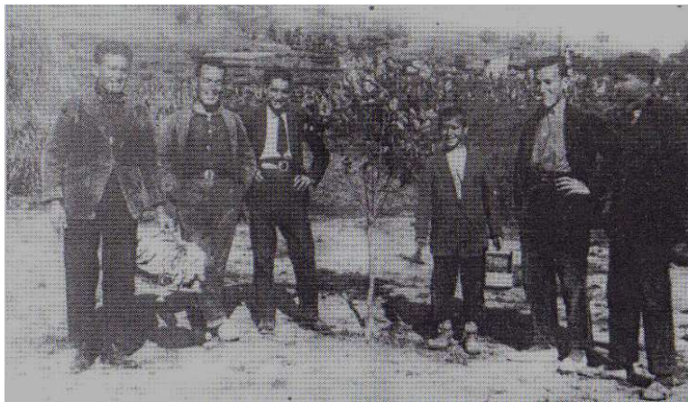
Grup de caçadors d'ocells al costat dels rams. Principis del s. XX.

Igual que en el cas del novells les femelles són alliberades immediatament i sols es retenen els mascles fins al nombre màxim permès en l'any de cada espècie.