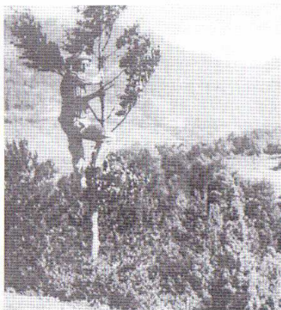
Caçador en un arbre de novells als 70.

En aquests dies es porta a terme la caça dels exemplars joves nascuts mesos abans. D'aquesta manera s'aconsegueixen ocells més joves i dòcils per educar-los en la qualitat del cant. Aquests exemplars es distingeixen per estar mancats de la coloració típica dels adults. Fet que provoca problemes alhora de determinar el seu sexe, ja que sols poden agafar-se els mascles. En cas d'atrapar algun exemplar vell, distingible per la coloració d'adult cal alliberar-lo, ja que podria estar a càrrec d'algun niu i la seva captura posaria en perill la niuada.