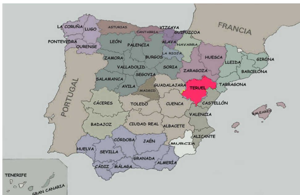
Gráf. 2. Mapa localización geográfica provincia de Teruel

La provincia de Teruel pertenece a la Comunidad Autónoma de Aragón junto a las provincias de Zaragoza y Huesca. Geográficamente la provincia está situada en la parte nororiental de la península ibérica y su capital es la ciudad de Teruel (Gráf. 2).