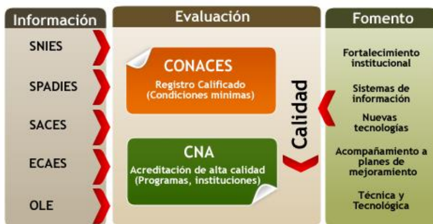
Cuadro N°1: Subsistemas del Sistema de Aseguramiento de la Calidad