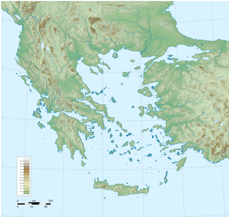
Mapa topogràfic de Grècia.