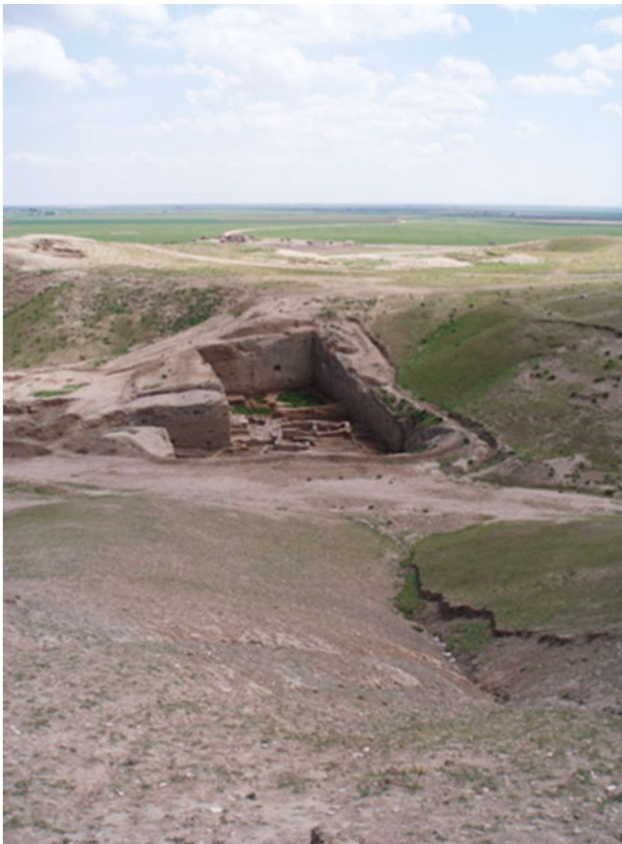
La majoria de jaciments arqueològics al Pròxim Orient es caracteritzen per la seva forma de tell , és a dir, de muntanyes artificials formades per les múltiples capes resultat de les successives ocupacions humanes al llarg de molt de temps. En la fotografia, una imatge del jaciment de Tell Brak, a Síria.