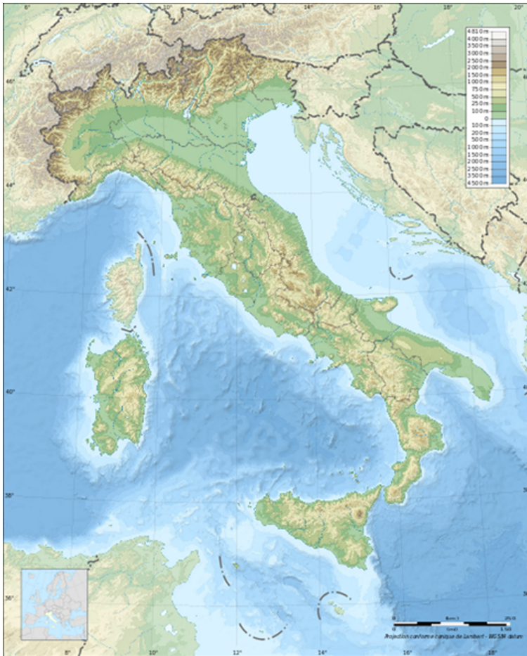
Mapa topogràfic de la península Itàlica.

Al llarg de la seva història Roma va anar ampliant el seu territori en diverses fases, primerament va aconseguir el domini polític de la península Itàlica. A continuació es va anar expandint fins a acabar estenent-se més enllà dels Pirineus a l'oest, al nord: des de les illes Britàniques fins al Mar Bàltic, al sud: per la costa del nord d'Àfrica, i a l'est, fins a l'Eufrates.