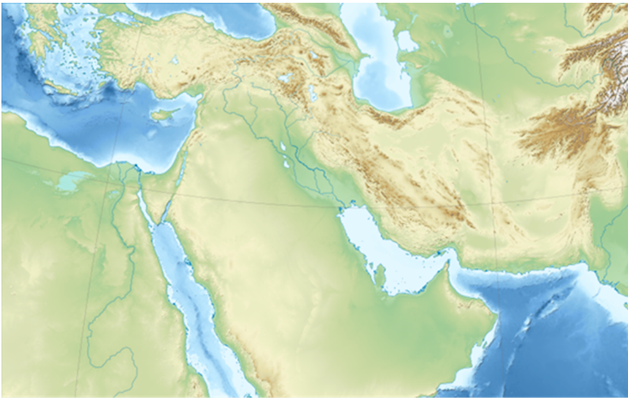
Mapa topogràfic del Pròxim Orient.

A orient d'aquestes regions es troba la cadena muntanyenca dels Zagros, i al sud-oest la plana iraniana, seu del regne de l'Elam i de pobles com els medes i els perses. A occident de l'Eufrates apareix l'estepa siriana abans d'arribar a la costa, on es van establir importants cultures amb destacats centres com Ebla i Mari al tercer mil·lenni. L'estreta franja de terra entre el Mediterrani i les muntanyes del Líban i l'Antilíban va estar ocupada per multitud de pobles (cananeus, fenicis, filisteus, etc.). Al nord, el centre d'Anatòlia serà ocupat pels hittites al segon mil·lenni, i entre aquesta zona i fins al Caucas van viure nombrosos pobles com els hurrites i els urarteus. Totes aquestes cultures van interactuar en major o menor mesura i intensitat en funció de les diverses circumstàncies històriques.