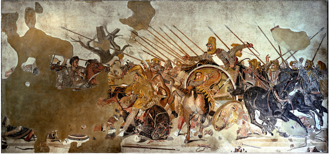
Mosaic procedent de la casa del Faune, Pompeia (Museu Arqueològic Nacional de Nàpols).