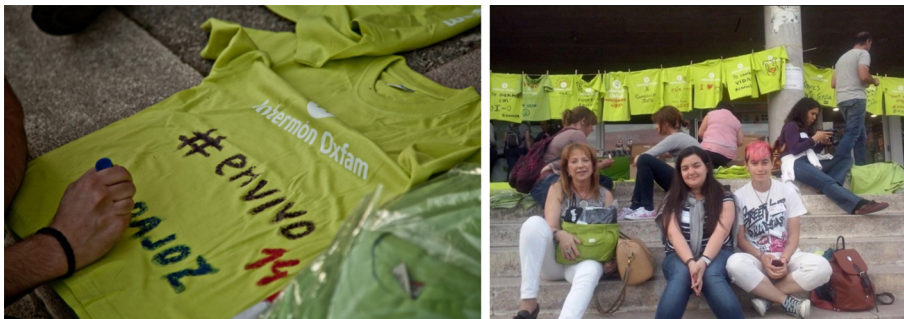
Imágenes del taller de camisetas

Otra de las propuestas del equipo de comunicación consistió en reciclar todas las camisetas que había almacenadas con el viejo logo y escribir en ella los deseos y las impresiones. Se hizo un tendedero a modo de exposición con las camisetas y finalmente cada una de las personas pudo recoger la suya y llevársela como recuerdo.