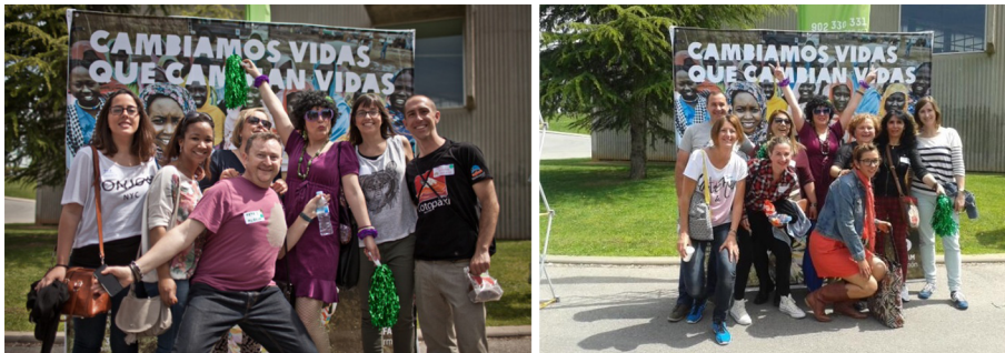
Imágenes del photocall

En el ENVIVO de 2014 se propuso que durante los momentos informales, entre conferencias y talleres, las personas del equipo se hiciera fotos frente a un nuevo photocall con el lema de la organización «Cambiamos vidas que cambian vidas» y que, posteriormente, las publicaran en sus redes sociales con el hashtag #ENVIVO14. También se las animó a que compartieran frases y emociones de ENVIVO en las redes sociales para compartir con el público en general, pero especialmente con las personas del equipo que no estaban en el evento.