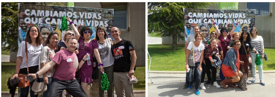
Imatges del photocall

VO14. També se'ls va animar a compartir frases i emocions d'ENVIVO a les xarxes socials, per a fer partícips de l'esdeveniment el públic en general i, especialment, les persones de l'equip que no hi eren.