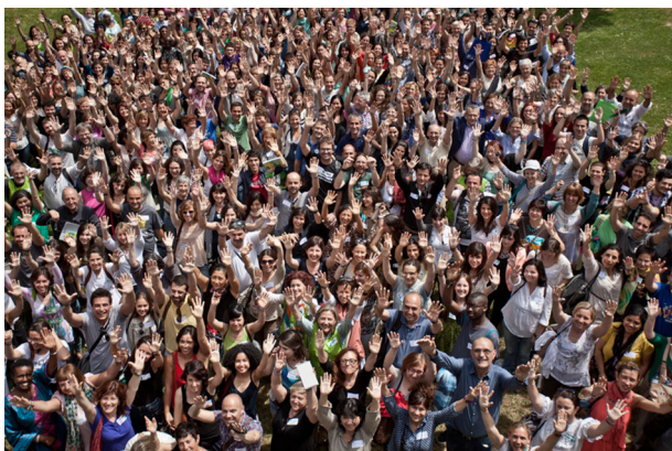
Imatge d'equip d'ENVIVO 2014

Tradicionalment, entre les sessions de matí i tarda de dissabte, que acostumen a ser les més multitudinàries, es realitza una foto de tot l'equip. Aquesta fotografia s'utilitzarà al llarg de l'any, sobretot internament, per a transmetre la idea que som un equip i per a donar una imatge positiva de l'organització.