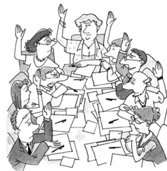
El president ha de sotmetre el veredictes a les deliberacions del jurat, format per nou persones.

A continuació, els jurats es retiren per a deliberar , i romanen incomunicats durant tot el temps que dura la deliberació. Després de la deliberació es produeix la votació sobre els fets consignats en els paràgrafs de l'escrit en què es recull l'objecte del veredictes. Segons l'article 59.1 de la LOTJ, perquè un fet es declari provat, es requereixen set vots, quan sigui contrari a l'acusat; i cinc, quan hi sigui favorable.