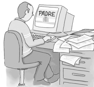
L'aplicació dels tributs comprèn les actuacions de gestió

Són diverses les vies de control de l'Administració, segons l'objecte de la comprovació; hi distingim entre verificació de dades, comprovació limitada i comprovació de valors. En cada cas, els mitjans de comprovació que es poden exercir són diferents i l'abast de l'actuació de control, també.