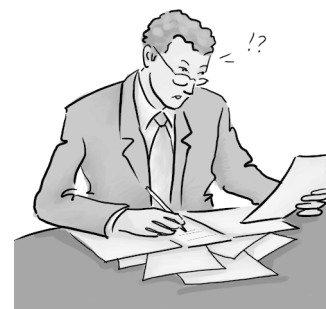
Les operacions de liquidació pressuposen la interpretació i l'aplicació de l'ordenació jurídica tributària