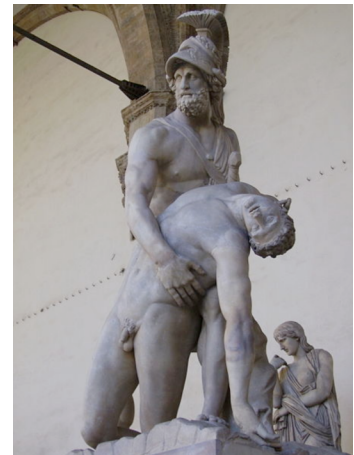
Menelau portant el cos inert de Patrocle, mort a mans d'Hèctor a la guerra de Troia.

Un bon exemple que il·lustraria això seria el que posa Catherine Orenstein (2003) al seu llibre Caperucita al desnudo , en què analitza el discurs implícit-explicit i la narració del conte infantil La caputxeta vermella , i assenyala com ha variat amb el temps, segons el segle i l'època.