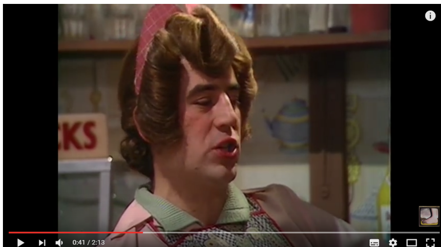
Imatge 1. Sketch Spam.