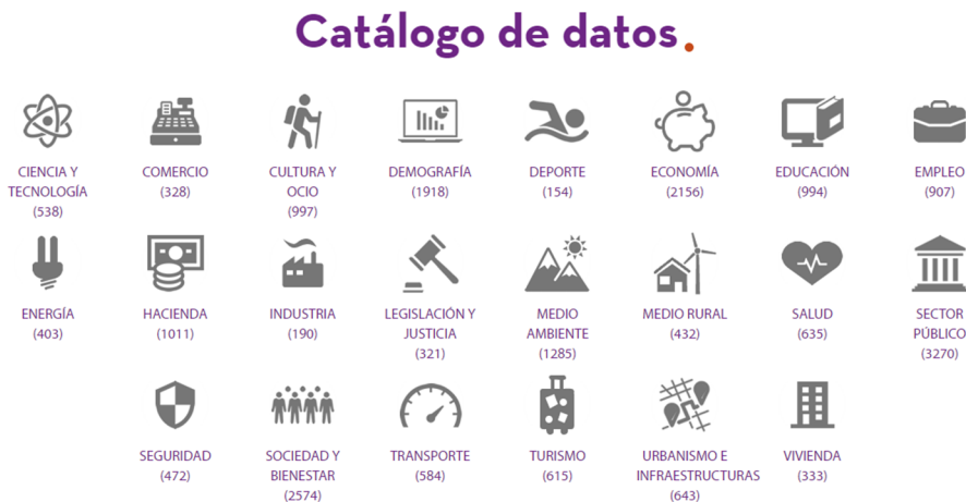
Figura 1. Exemple de catàleg de dades en el portal de dades obertes del Govern d'Espanya.

La descripció del catàleg i els recursos d'informació s'ha de fer mitjançant fitxes en què es recullen les metadades exigides per l'NTI de reutilització.