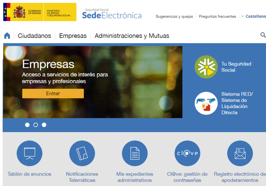
Figura 2. Seu electrònica de la Seguretat Social

El Consell Superior d'Administració Electrònica va publicar en 2010 una guia de seus electròniques que és il·lustratiu de les característiques, funcions i prestacions que tenen encomanades.