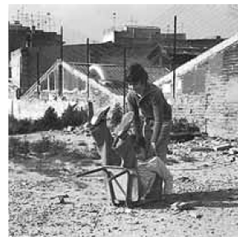
Nens de minories ètniques que viuen a Catalunya

Reflexioneu sobre la definició d'identitat hipotecada, reviseu els trets de personalitat que porta associats, i intenteu trobar alguna relació entre la freqüència amb què es presenta aquest estil d'identitat, en l'adolescència i més enllà de l'adolescència, i els patrons culturals, familiars i educatius.