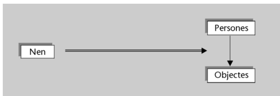
Relació de l'infant amb la relació entre els altres i els objectes.

En l'última anàlisi, l'infant no solament es relaciona amb els seus interlocutors, amb les accions i amb els objectes, sinó que també es relaciona amb la relació que les persones estableixen amb els objectes (Hobson, 1994).