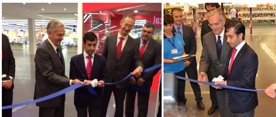
Foto de grup.

Paral·lelament, pugen els músics a l'escenari per l'escala lateral esquerra i interpreten una peça musical suau mentre té lloc el tall de la cinta inaugural. Quan s'acaba l'escena del tall de la cinta, la música augmenta de volum fins a la fi de la peça musical.