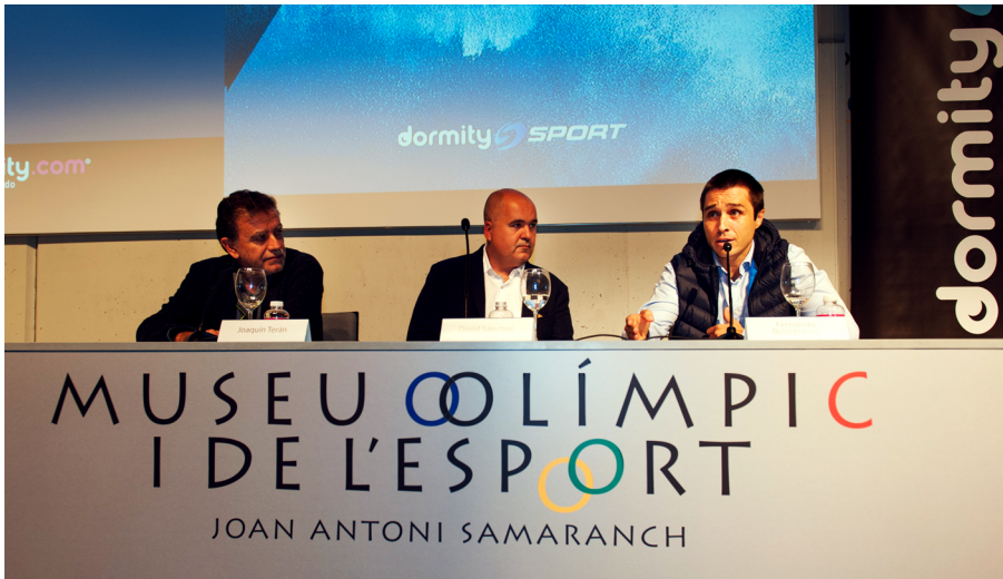
Figura 14. Imagen del acto de presentación