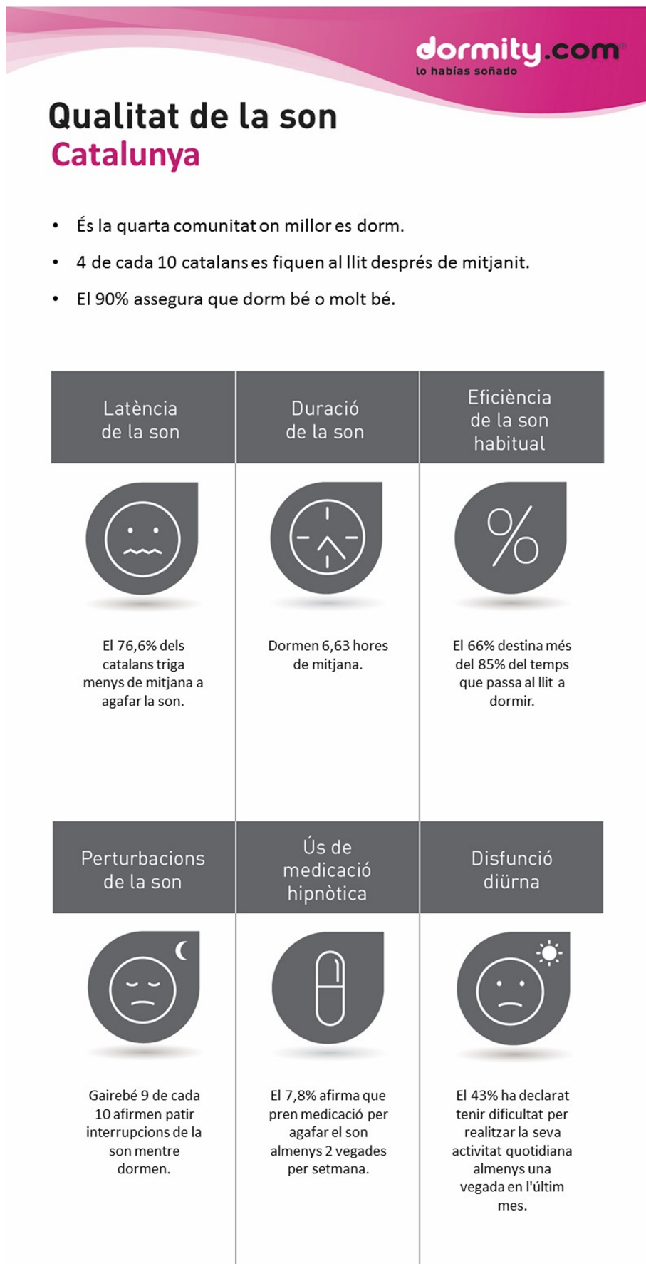
Figura 12. Ejemplo de infografía sobre la calidad del sueño en Cataluña