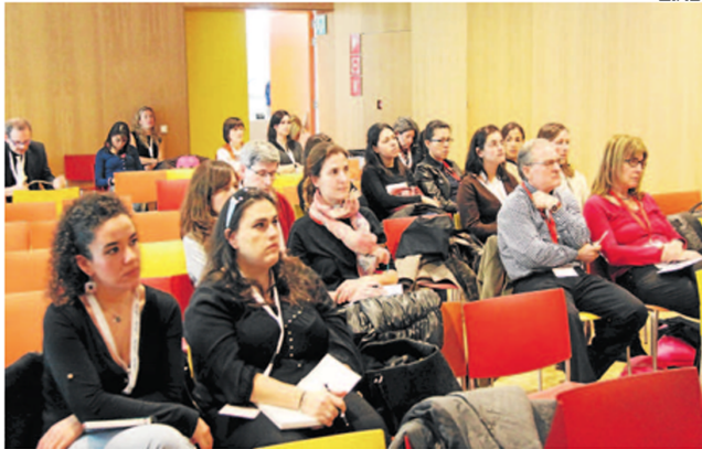
Neurólogos, otorrinos, pediatras, cardiólogos, neumólogos o psicólogos son algunos de los 200 profesionales que asistieron al congreso.

S. URICO ¿Qué le haría tomar la decisión de pasar y vivir en un lugar que no tiene servicios médicos ni hospitales para la salud? El 88% de los leídos tiene alguna perturbación en el sueño, según se ve en el II estudio del Hospital Dormity sobre la calidad del sueño de los habitantes de Sabadell. Desde el estudio se extraen algunas conclusiones que ayudan a entender mejor la importancia de dormir bien en la vida cotidiana. El estudio se realizó en Sabadell, una ciudad de 170.000 habitantes, y se basó en una encuesta online que se envió a los usuarios de la web Dormity.com. Los resultados muestran que el 88% de los leídos tiene alguna perturbación en el sueño, como el insomnio, la apnea o la narcolepsia. Los expertos recomiendan dormir entre 7 y 9 horas por noche y sugieren algunas estrategias para mejorar la calidad del sueño, como evitar el uso de dispositivos electrónicos antes de dormir y mantener un horario regular de sueño.