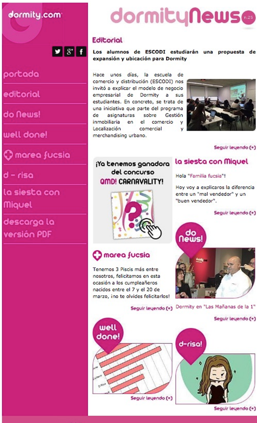
Figura 4. Ejemplo de un boletín quincenal