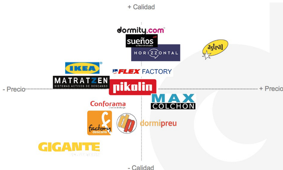
Figura 3. Posicionamiento de Dormity en el sector

A continuación se presenta el mapa de posicionamiento de la marca en el sector, atendiendo a los aspectos clásicos de calidad y precio.