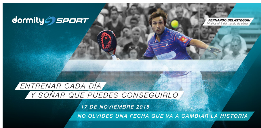
Figura 13. Ejemplo de invitación