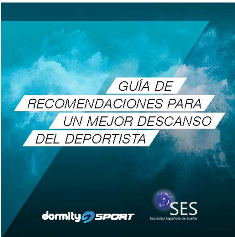
Figura 15. Imagen de la Guía