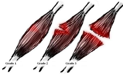
Figura 1. Grados de lesiones musculares (2).