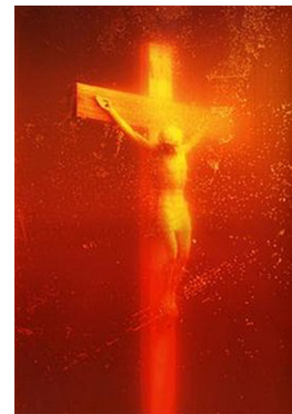
Fotografia de l'obra Piss Christ (1987), d'Andrés Serrano. En aquesta obra fotogràfica s'observa un crucifix submergit en orina. El senador Jesse Helms la va censurar amb el suport de l'Associació Conservadora de les Famílies Americanes Cristianes, que van fer cancel·lar l'exposició al Southeastern Center for Contemporary Art a Winston, Salem, Carolina del Nord.

El debat real no estava tant en els diners dels premis o les acusacions d'obscenitat d'aquestes peces artístiques, que també, sinó en els desacords sobre quina història s'ensenyava a l'educació i quins valors s'havien de perpetuar. Les disputes es renyien entre els que estaven a favor del rol del govern de donar suport a la vida cultural nacional i aquells que no hi estaven disposats. Els que hi estaven a favor es fixaven en Europa, en els seus precedents històrics i en la necessitat de promoure les arts i la formació en disciplines i activitats que no havien rebut el suport de la filantropia privada o del mercat. I els que s'hi oposaven sovint ho feien des d'un discurs liberal en contra de la