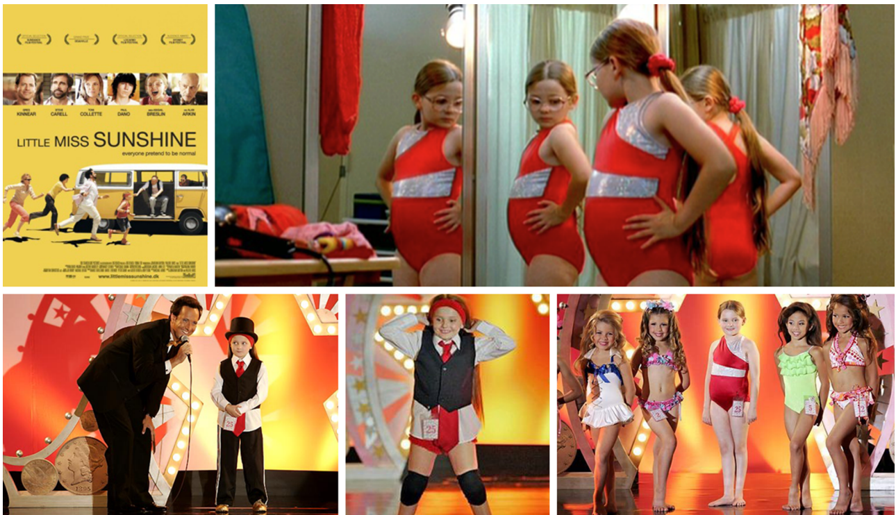
Caràtula i fotogrames de la pel·lícula Petita Miss Sunshine

La manera com Pixarvolt imagina l'humà i el no humà ens permet revisar les categories tradicionals sobre les relacions socials, la corporització, l'estatus del que es considera animal, l'humà, l'alteritat, la sociabilitat, la biodiversitat animal i material, les noves concepcions sobre el cos, la naturalesa arran dels