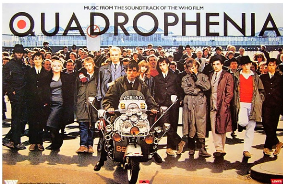
La pel·lícula britànica Quadrophenia (1979), dirigida per Franc Roddam, està basada en l'òpera rock de 1973 amb música composta per The Who. Retrata amb bastant encert la Gran Bretanya protopunk de l'època preThatcher i el narcicisme de la joventut britànica incrementat pel consum d'amfetamines durant la dècada dels seixanta. També mostra les contínues batalles entre mods i rockers que es van succeir en diverses localitats al llarg de l'estiu de 1964. El film reflecteix el que, entre altres coses, separa aquestes dues subcultures: la música que consumeixen (música mod o rock'n'roll ), el mitjà de transport (l'escúter Vespa Lambretta farcida de miralls retrovisors en el cas dels mods o les motocicletes de gran cilindrada en els rockers) i l'estil en el vestir (vestits impecables en els mods , però no cars, ja que aquests joves procedien de classe treballadora d'extraradi, o cuir en el cas dels rockers).