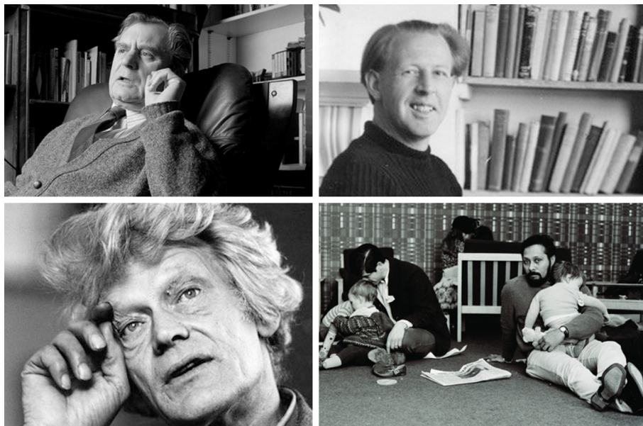
A dalt a l'esquerra, Richard Hoggart. A dalt a la dreta, Raymond Williams. A baix a l'esquerra, Edward P. Thompson. A baix a la dreta, Stuart Hall en la primera «Women's Conference» al Ruskin College, Oxford, 1970