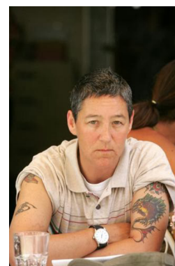
Judith / Jack Halberstam