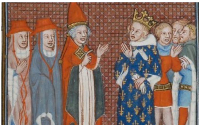
El rei de Sicília Carles d'Anjou i el Papa Martí IV

“e deïm que vós e tot hom qui diga que ell sia entrat e'l regne de Sicília malvadament e no deguda, ment com a fals e deslleial; e que us he menarà per batalla cors a cors e donar-vos ha avantatge d'armes, aitals co us vullats” (Desclot 1987:192).