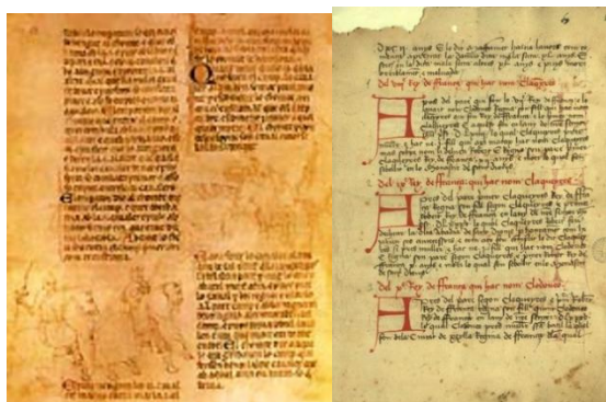
Pàgina de la Crònica del Rei Pere II, escrita per Bernat Desclot (14 de novembre de 1283)

En aquest sentit, Ferran Soldevila (1994:13) apunta que “tots aquests extrems (les acusacions) i els que precediren la composició dels pactes es troben continguts en les lletres o manifestos publicats pels dos reis amb data del 30 i 31 de desembre de 1282. De fet, tot just tres dies després de la publicació dels manifestos, el rei Pere va signar una carta on declara novament, per treure tota suspicàcia o dubte, que promet respectar Carles d’Anjou i la seva comitiva [...]”