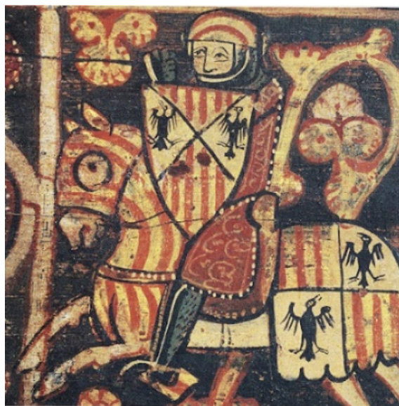
Imatge de Curial

Hi podem trobar elements trobadorescos com la Cançó de l’Orifany , que el jove cavaller compon a Tunis i que com descriu Martí de Riquer (1964:216) es creia que era “ una bèstia que no es pot redreçar fins que els seus companys no criden tots alhora a favor seu ”; de fet l’ orifany apareix com a un dels personatges protagonistes a El llibre de les bèsties de Ramon Llull. Rigaut de Berbezilh, un trobador de l’època, va escriure el vers Atréssí com l’aurifany , atribuït teòricament a Curial un cop és fet pres pel rei de Tunis. Al Curial e Güelfa hi apareix explícitament: “ E així, com aquests dos captius foren davant ella, fonc-los manats que cantassen e ells començaren a cantar la canó de l’orifany. ” ( Curial e Güelfa 2011:480)