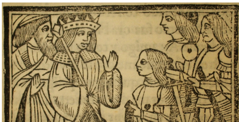
Imatge de Curial e Güelfa .

Afirmen Lola Badia i Jaume Torró (2015: 84) en relació amb la literatura del Curial e Güelfa que «la trama del Curial està bastida a partir de materials trobadorescos filtrats per la recepció italiana [...]. El filtre italià de les antigues fonts trobadoresques i catalanes, alhora que les modernitza, els atorga prestigi literari». I certament, era tan important guanyar batalles com publicitar-les a través de la música i de la literatura, dels cerimonials i de l'heràldica.