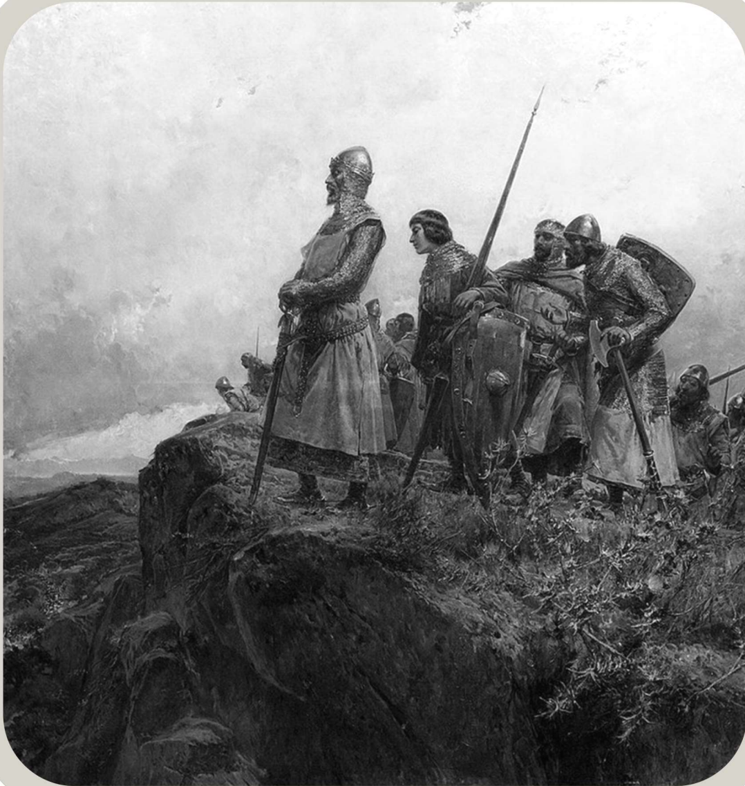
Pere III el Gran al Coll dels Panissars (Mariano Barbasán, 1891)

El Desafiament de Bordeus i el torneig de Melú