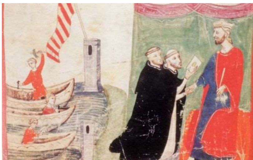
Preparatiu de Pere II per anar cap a Sicília. El rei rep la visita de dos frares dominics enviats pel Papa Martí IV

El Desafiament de Bordeus és un dels capítols més extraordinaris del seu temps. Va ser un desafiament llançat per Carles d'Anjou al rei Pere el Gran, com a conseqüència de la conquesta de l'illa de Sicília provocada per la revolta de les conegudes com a Vespres Sicilianes , l'any 1282. Carles d'Anjou va reptar el rei Pere a un torneig que s'havia de celebrar a Bordeus (territori neutral, amb l'arbitratge del rei d'Anglaterra) entre 100 cavallers del regne de França i 100 cavallers de la Corona d'Aragó en el qual es jugarien els seus regnes, i que havia de tenir lloc l'1 de juny de 1283.