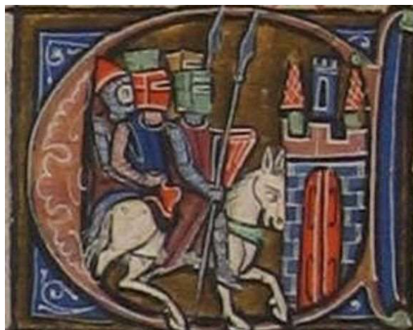
El Desafiament de Bordeus (1283)

Bernat Desclot apareix com a testimoni directe dels fets més destacats de la vida de Pere II el Gran, ja que com ell mateix diu a l'inici del llibre, en la seva crònica tracta: “els grans feits e de les conquestes que feeren sobre sarraïns e sobre altres gens los nobles reis que hac en Aragó qui foren de l'alt llinatge del comte de Barcelona.” (Desclot 1987:43). Desclot té molta cura, però, a mantenir-se ell en un segon terme, no vol protagonisme perquè el protagonista és el rei. Així, l'únic capítol en el qual Desclot es refereix a si mateix com a testimoni dels fets és quan una fletxa “va clavar-se a l'arçó de la sella del rei en el combat de Santa Maria d'Agost” . “E d'açò fa testimoni cel qui açò recompte en aquest llibre he vahé la cella del rey e lo ferro que 'y era romàs” (Desclot 1987: cap. CLIX).