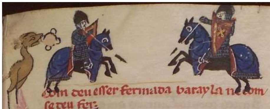
Representació del Desafiament de Bordeus

A causa de la revolta es va produir la divisió del regne de Sicília el 1282 en el regne de Sicília peninsular o regne de Nàpols -que aleshores comprenia Sicília i Nàpols-, sota domini dels Anjou, i el regne de Sicília insular, sota domini del comte de Barcelona. La Mediterrània era, certament, un mar perillós i tot i que l'objectiu dels comtes de Barcelona era eixamplar els seus dominis, primer havien de tenir punts estratègics i un era l'illa de Sicília (Ferrer 1999:145). Cal destacar que en aquells moments hi havia dos bàndols polítics: