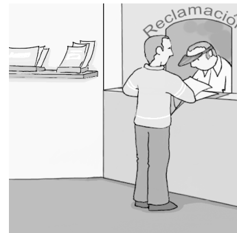
La revisió d'actes tributaris admet diferents vies d'articulació.

Al seu torn, les reclamacions economicoadministratives posen fi a la via administrativa en l'àmbit estatal (en l'esfera local no n'hi ha, per la incompatibilitat amb les exigències de l'autonomia local, excepte en els municipis de gran població en els quals hi ha tribunals economicoadministratius municipals). La tramitació i resolució d'aquest tipus de recurs correspon a l'òrgan economicoadministratiu competent, en primera o única instància, segons el tipus d'acte impugnat (la quantia, l'òrgan que el va dictar). L'òrgan economicoadministratiu pot actuar també de manera unipersonal en alguns supòsits determinats per a dotar de més agilitat la resolució de les reclamacions.