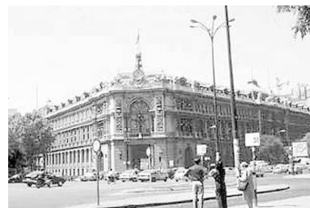
Seu del Banc d'Espanya

Finalment, quant a la fase d' execució del dret a la devolució, independentment de si el reconeixement del dret a la devolució ha vingut pel procediment de l'article 221 LGT o per un altre procediment o procés, s'inicia amb la notificació de la resolució i l'expedició del corresponent manament de pagament a favor del creditor. El pagament es farà amb un xec barrat contra el compte del Tresor al Banc d'Espanya, una transferència bancària o una compensació. A la sol·licitud s'haurà assenyalat el mitjà triat pel subjecte.