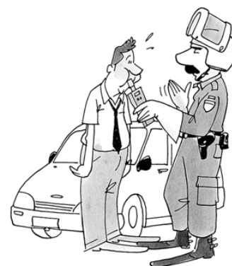
Diligencias policiales de difícil reproducción son, por ejemplo, la prueba de alcoholemia, la filmación en videocámara, etc.

Aspecto este último que plantea la dificultad de aplicar a tales efectos el art. 730 LECrim, ya que, como hemos señalado, este precepto se refiere específicamente a las diligencias sumariales y no a las diligencias policiales.