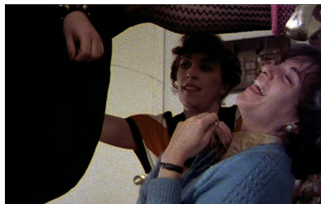
Fotograma extraído de la película “ Pepi, Luci, Bom y otras chicas del montón ” (1980)

Cabe en este punto plantear la siguiente pregunta: ¿podría estrenarse esta película hoy en día en las salas de cine de toda España o existiría algún tipo de “censura” que obligara a que esta película no fuera tan explícita o a que se estrenara en salas de cine especiales? ¿hemos de suponer que durante los años de La Movida existía una libertad cultural y de expresión que actualmente hemos perdido?