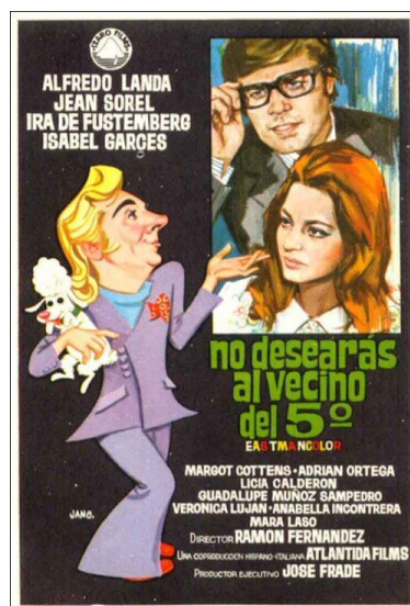
Poster No desearás al vecino del 5º 47

Los guiones que correspondían a este tipo de personajes evolucionan hasta la actualidad con películas como “ Dolor y Gloria ” (2019). En la película de Pedro Almodóvar, premiada por la Academia de Cine en la 34 edición de los Premios Goya 48 , muestra a un director de cine en horas bajas mientras vemos momentos de su pasado y su presente contados con total naturalidad y sin rastro de la ridiculización que se hizo popular en los años 70.