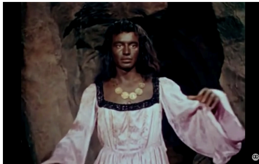
Fotograma extraído de la película “ Aventuras de Robinson Crusoe ” (1954)

A esta escena, le seguirán otras que demostrarán un tímido acercamiento íntimo entre Crusoe y este personaje donde algunos estudiosos ven indicios de una homosexualidad mutua.