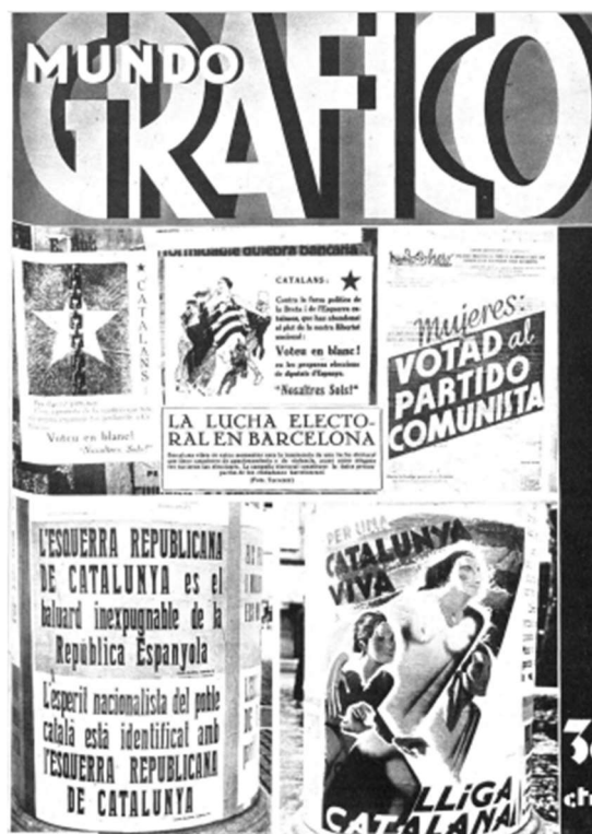
Portada del "Mundo Gráfico" del 15/11/33 amb diversos cartells electorals, un dirigit directament a les dones del Partido Comunista i un amb la imatge d'una dona que podria ser al·legòrica (sembla que la dona va nua, tot i que en l'original que es conserva va vestida com es pot veure a https://mdc.csuc.cat/digital/collection/pavellorepu/id/149/ )

A Espanya van tenir eleccions municipals pocs dies després, el 23 d'abril, a gairebé 2.500 municipis, aquells que no havien tingut eleccions municipals l'any 1931. Van ser les primeres que hi participaven les dones com a votants. A Catalunya no es van convocar fins al gener de 1934 ja que les competències sobre les eleccions municipals les tenia la Generalitat. El 19 de novembre de 1933 es van celebrar les segones eleccions generals de la República, on van participar més de sis milions d'electores. No en va sortir escollida cap diputada catalana; de fet això va ser perquè els partits no les van posar en cap lloc que tingués possibilitats (de fet algun, com La Lliga, no en posà cap). En qualsevol cas, la importància principal vindria donada per la concessió del vot a les dones i per la inclusió de les dones com a col·lectiu en el sí dels partits.