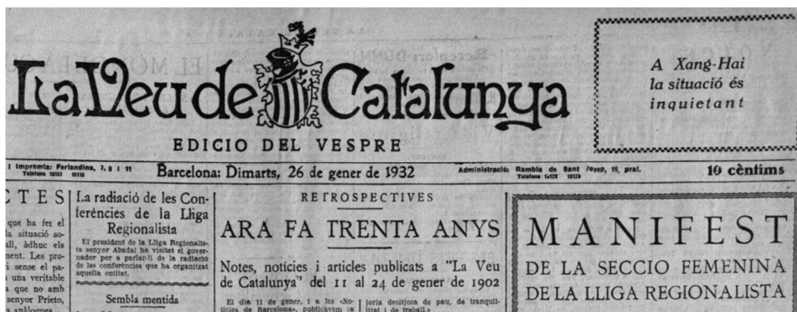
Capçalera de "La Veu de Catalunya" del 26/01/32 edició del vespre on es veu la publicació de Manifest de la Secció Femenina de Lliga Regionalista