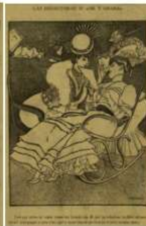
Fotografia al 1r número d'Or i Grana a sota el títol "Las redactoras d'Or i Grana" i el subtítol "Unas servidoras de vostés" i la il·lustració d'Opisso del número 2 sota el títol "Las redactoras d'Or i Grana".

En el número 2, ens expliquen que porten més d'un any treballant en el projecte, que segurament s'hagués materialitzat abans sinó hagués estat pels fets del novembre anterior, que van fer que tinguessin tasques a fer més urgents. Es refereixen als Fets del setmanari ¡Cu-cut! , quan l'exercit va assaltar aquella revista per una vinyeta que ironitzava sobre les derrotes de l'exercit espanyol. Arran d'aquest fet, el govern espanyol suspengué les garanties constitucionals a Barcelona i impulsà la Llei de Jurisdiccions, que permetria als militars poder jutjar tot allò que consideressin que atemptava contra la unitat de l'Estat espanyol o contra ells mateixos. Davant d'aquest fet, va néixer Solidaritat Catalana. El suport entusiasta a Solidaritat Catalana i la denúncia de l'esmentada llei repressora seran constants en Or i Grana . També la revista, i amb ella el projecte de Dames Patriòtiques, s'hagués pogut portar a terme abans, si no fos per un fet anual ineludible per a unes bones burgeses: "si la desbandada estival no hagués disgregat temporalment à las organisadoras".