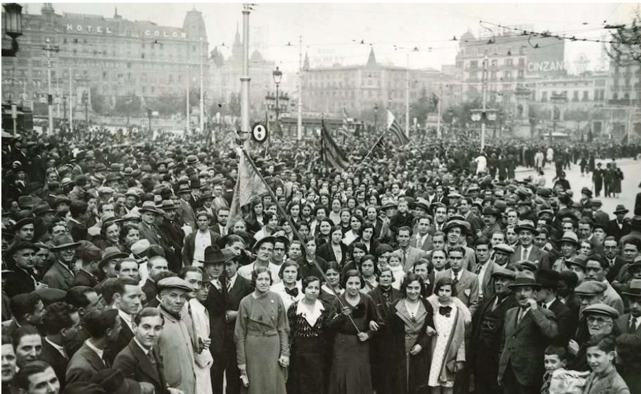
14 abril 1933. Barcelona, Plaça Catalunya. La secció femenina d'Esquerra de Sant Adrià de Besòs a la manifestació cívica en commemoració del segon aniversari de la proclamació de la República.

Una de les accions destacades que va dur a terme la Secció va ser impulsar, al maig de 1932, el Front Únic Femení Esquerrista per a la defensa de la República que es veia en perill ("per a oposar una força poderosa a les organitzacions de dones enemigues de la República i de tots els ideals de Llibertat" deien les seves bases), una organització que no estaria adscrita a cap partit polític ("les seves components no perdran la personal afiliació política, però quan actuïn el nom del Front Únic no podran defensar cap ideologia del partit o de classe", també indicaven).