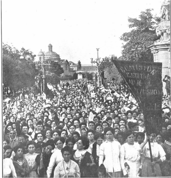
Fotografia publicada a tota plana en la portada de la revista "Nuevo mundo" (Madrid) del 14 de juliol de 1910.

l'agrupació Damas Rojas i Damas Radicales 11 , i sota el lideratge d'Ángeles Lopez de Ayala. Entre les, segons algunes fonts, 5.000 assistents hi havia dones de Barcelona i d'altres poblacions catalanes i es feia en suport a les polítiques anticlericals previstes pel govern (ja que reclamaven una escola laica i drets per a les dones i es manifestaven a favor del dret de consciència). Molta premsa se'n va fer ressò i es van publicar diferents fotografies; en la notícia de La