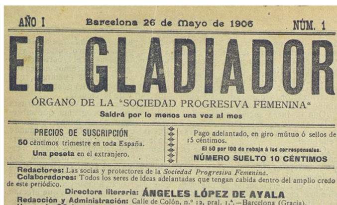
Capçalera del primer número d'"El Gladiador" (26 de maig de 1906) que es troba a l'hemeroteca digital de la Biblioteca Nacional de España.

Fins la seva desaparició l'any 1919 aquesta associació defensà els valors del laïcisme i de l'anticlericalisme i de l'emancipació de les dones. Ángeles López de Ayala i Amàlia Domingo Soler impulsaren publicacions como ara El Gladiador , que foren fòrums d'un ideari laïcista i emancipador. Associades al republicanisme lerrouxista, les feministes republicanes tenien el propòsit de secularitzar els costums i l'acció social de les dones i allunyar-les de l'òrbita d'influència eclesiàstica. L'educació de les dones i la seva formació en els valors cívics de la ciutadania era l'eix de la seva agenda d'actuació. Partidàries d'un feminisme progressiu que qüestionava el privilegi masculí, a partir de la primera guerra mundial, van adoptar la defensa d'un feminisme de la igualtat i dels drets polítics de les dones. En aquest sentit, es de destacar que el 1919 Ángeles López de Ayala assumeix la defensa del sufragi femení.