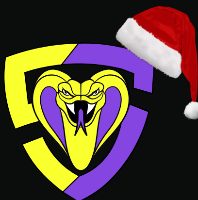
No invadir el área de protección de la marca*