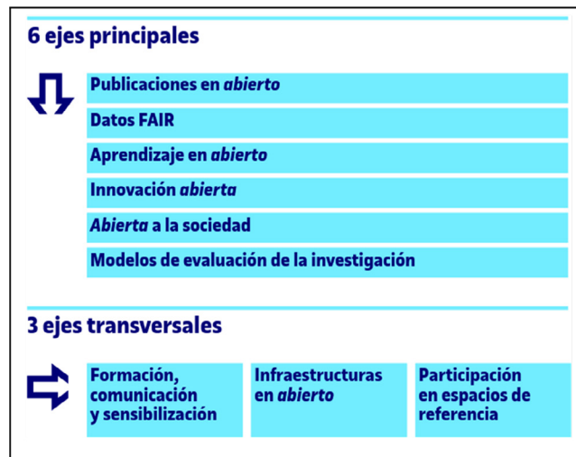
Figura 1. Ejes temáticos y transversales del Plan de acción de conocimiento abierto de la UOC

a ofrecer servicios de apoyo en la elaboración de planes de gestión de datos y en el depósito en abierto de los datasets .