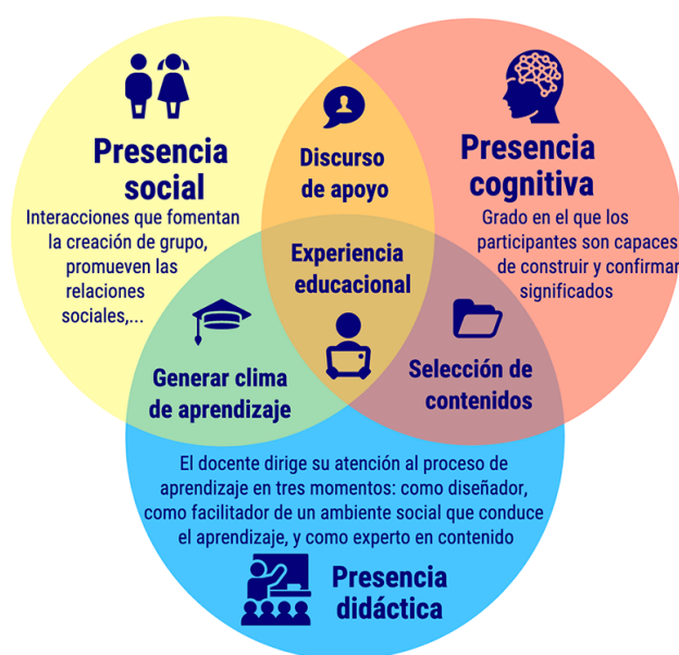
Figura 1. Dimensiones de la presencia

Pero, antes de nada, debemos preguntarnos, ¿cuáles son las funciones de un docente “presente” en un ambiente virtual 2.0 y, en consecuencia, cómo se puede atender a la necesidad de interacción (sin el cara a cara) del aprendizaje en línea? Justo a eso responde Maina y Morales (s.f.) con la siguiente figura: