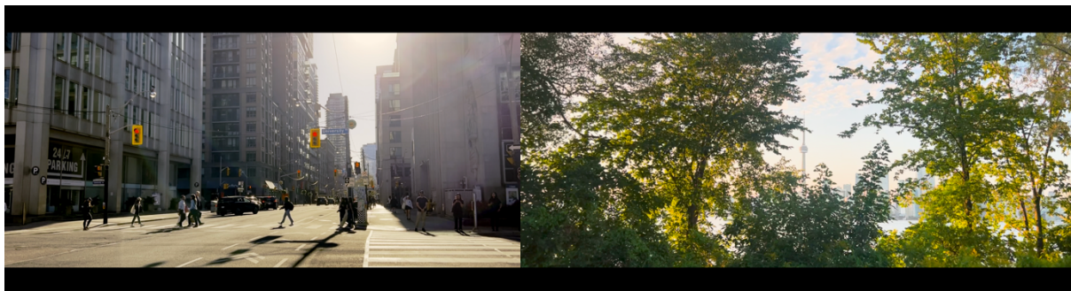
Verano, tonos cálidos e iluminados.

Al inicio del documental, se pueden apreciar tonos cálidos que predominan en el primer acto, introduciéndonos en el verano. Estos tonos reflejan una ciudad iluminada por los rayos del sol. Sin embargo, a medida que avanza el documental y nos sumergimos más en la narrativa, estos tonos cálidos comienzan a atenuarse, simbolizando el declive y la profundización de la crisis que se está abordando.