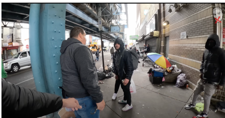
Fotograma del vídeo "Los zombies de Philadelphia"

[https://www.youtube.com/watch?v=qR5GU9La7dQ]