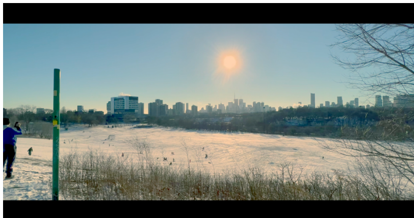
Invierno, con un tono frío, pero con una iluminación más alterada y como símbolo de esperanza.

La banda sonora, presente a lo largo de todo el proyecto, desempeña un papel crucial en la experiencia del espectador. Es importante destacar que se opta por utilizar música libre de derechos de autor, evitando así cualquier conflicto relacionado con derechos de propiedad intelectual. Esta elección no solo garantiza la legalidad del contenido, sino que también permite una mayor flexibilidad en la selección de piezas musicales que complementen y realcen la narrativa, sin restricciones legales.