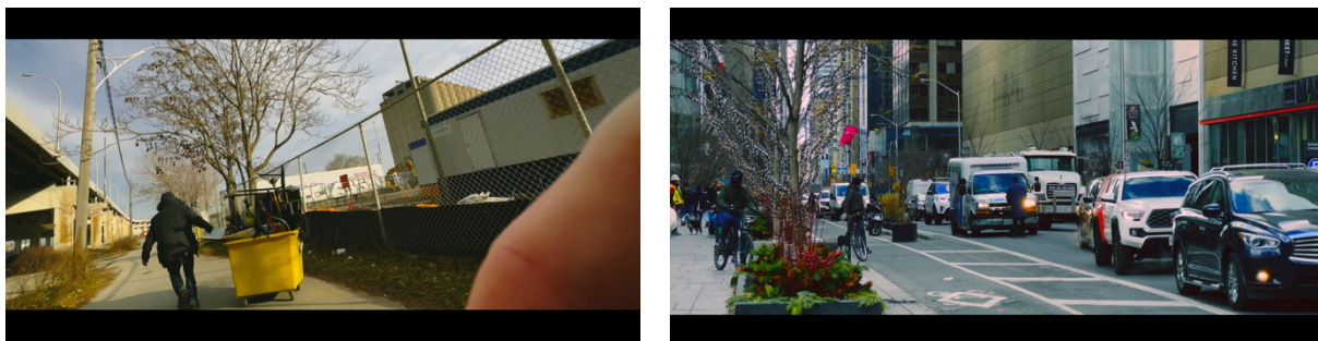
Invierno tonos fríos y apagados.

En el último acto, cuando conocemos la gravedad de la crisis y sus posibles soluciones, pasamos unos tonos entremezclados. Ejemplo en la siguiente imagen: