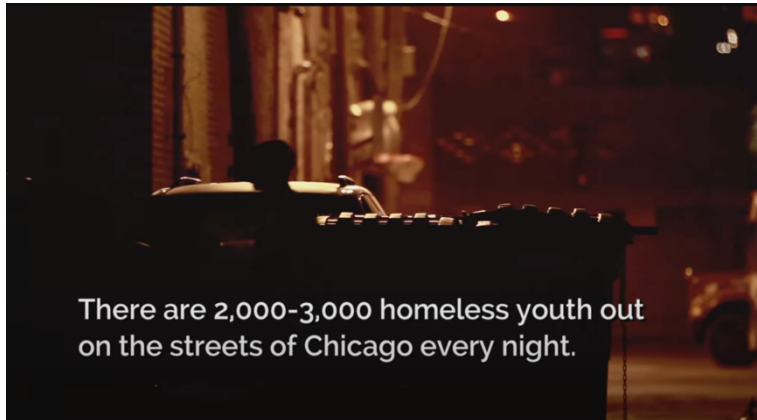
Fotograma del documental "The Homestretch" / YouTube

[https://www.youtube.com/watch?v=jiiboIQSYCw]