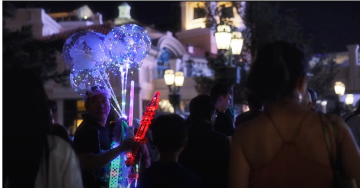
Fotograma del vídeo "Así viven en los túneles de Las Vegas" / YouTube

[https://www.youtube.com/watch?v=GCJDd4QrNDU]