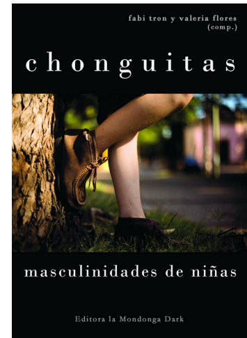
Figura 2. Coberta del llibre Chonguitas. Masculinidades de niñas .

I en aquell moment, a partir d'aquest descobriment, vaig pensar: «tinc prou material per endinsar-me en la seva obra, en el seu pensament, en la seva manera radical d'entendre i practicar la pedagogia; tinc prou material per processar-lo, estudiar-lo, depurar-lo i mostrar-lo a altres persones que poden estar interessades en la seva manera d'entendre i viure l'educació». Des d'aquell mateix moment (l'any 2014) i fins avui, val flores m'ha estripat el pensament i ha fet miques els pocs pilars que conformaven i sostenien la meva pedagogia.