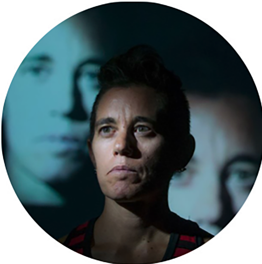
Figura 3. val flores, rostre