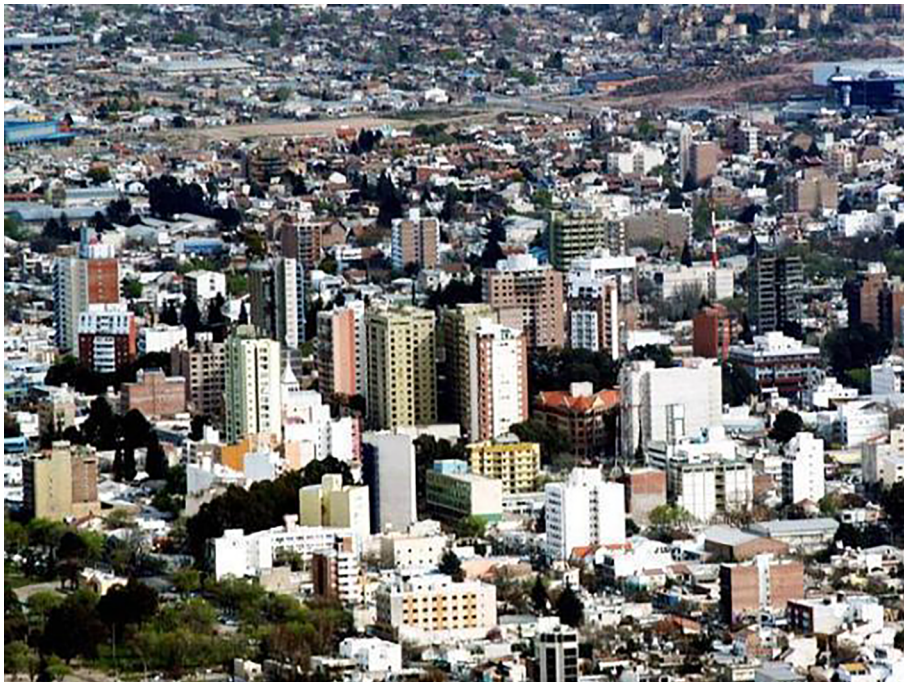
Figura 4. Ciutat de Neuquén