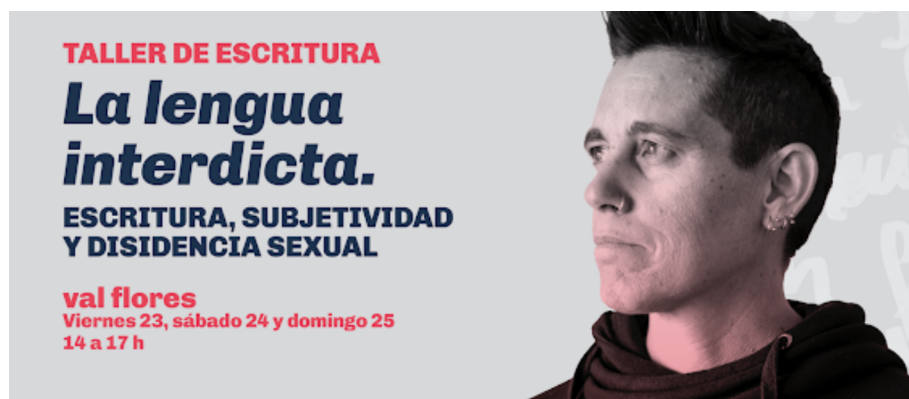
Figura 6. L'escriptura en val flores