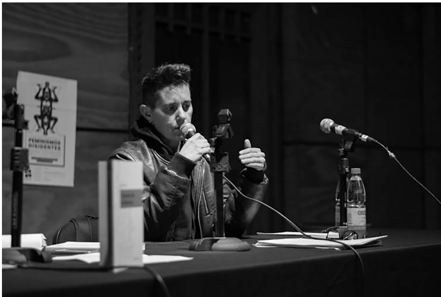
Figura 1. val flores impartint una conferència