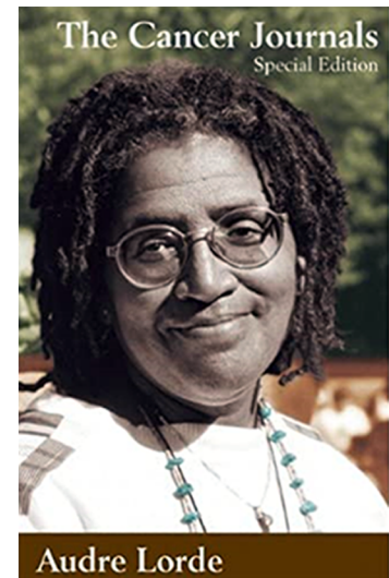
Figura 2. Portada de The Cancer Journals: Special Edition . Font: Audre Lorde (1980). The Cancer Journals: Special Edition . Aunt Lute Books

L'Audre Lorde és un emblema de la lluita racial, feminista, lesbiana i guerrera que, en certa manera, anticipa una pràctica i un discurs posteriorment circumscrit en la Queer Theory .