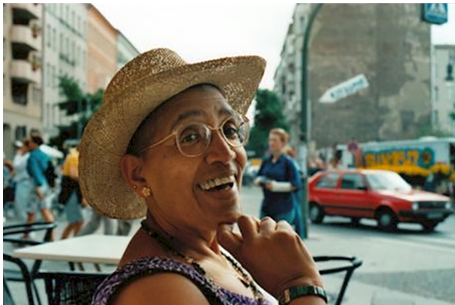
Figura 4. Audre Lorde en el documental Audre Lorde. The Berlin Years 1984 to 1992