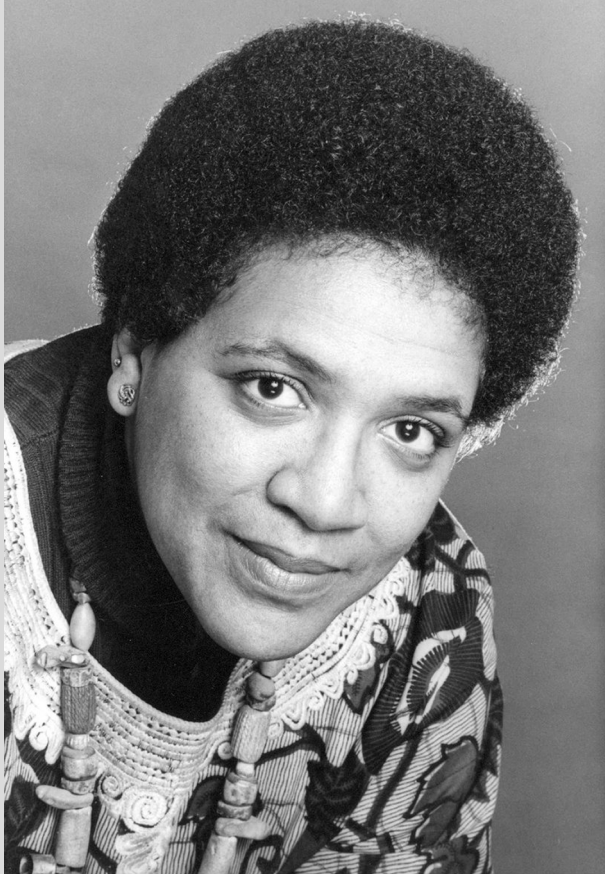
Figura 1. Audre Lorde (Nova York, 1934 - Saint Croix, 1992)