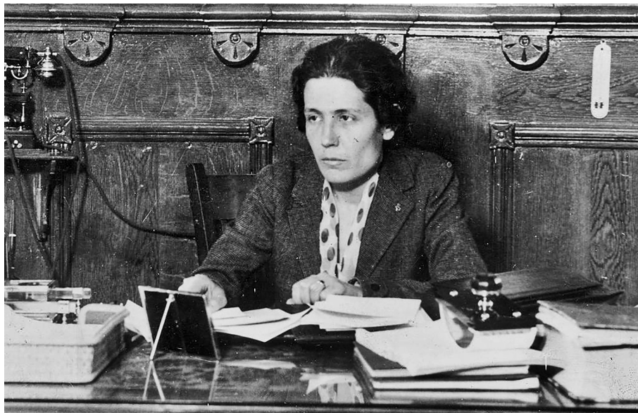
Figura 3. Victoria Kent, feminista, diputada a la II República i figura clau en la reforma de les presons i el tractament i defensa dels drets de les dones