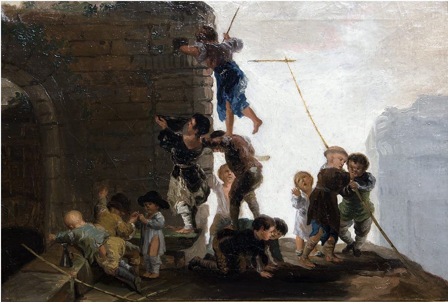
Figura 1. Relación de dependientes, ejercitantes y colegiales del Real Colegio de Niños Toribios (1793)